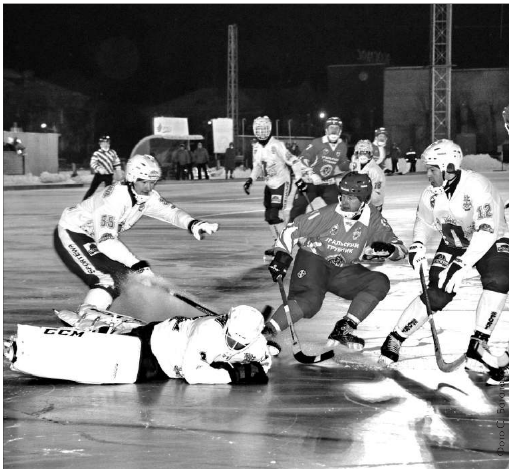
Кадр на память: открытие чемпионата России по хоккею с мячом в Первоуральске.