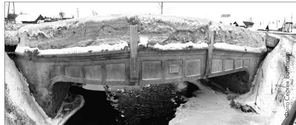
Этот мост построен в 1909 году

В планах – благоустройство улицы Орджоникидзе, от улицы Ленина до улицы Григория Бахчиванджи. Здесь раскинет-