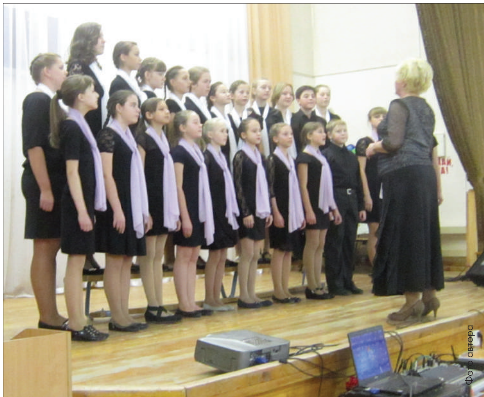
У хорового пения - особое звучание

Городской музыкальный конкурс «Надежда», состоявшийся в актовом зале школы № 2, был посвящен юбилею замечательного советского и российского композитора Александры Пахмутовой. Это неудивительно: мелодии этого талантливого автора мы помним с детства, они с нами всю нашу жизнь и, кажется, никогда не устареют.