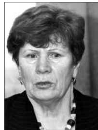
Почетный гражданин города Первоуральск

«Вечерка» решила узнать мнение первоуральцев.