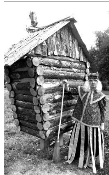
Летом на сказочной поляне можно было встретить и настоящую Бабу-Ягу

Как театр начинается с вешалки, так школа – с пришкольного участка. Безусловно, каждый школьный двор должен быть эстетичным, ухоженным и иметь игровые площадки, на которых в часы досуга ученики смогут отдохнуть.