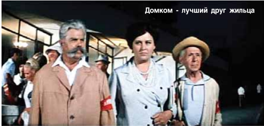
Домком - лучший друг жильца

Сегодня уже разработано положение о домовых комитетах, и, как только глава утвердит его своим постановлением, начну плотно работать с наиболее активными жильцами.