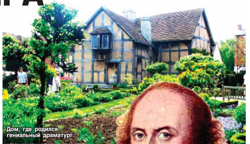
Дом, где родился гениальный драматург

Здесь же под стеклом хранятся копии документов о его крещении и отпевании. Настоятели храма очень приветливо и терпеливо относятся к толпам туристов, приезжающим поклониться литературному гению, один из священников даже попрощался с нами по-русски. В городе построен огромный театр, где идут шекспировские пьесы. Около великолепного здания разбит парк, на знаменитых английских газонах можно посидеть, полежать и даже поспать на лужайке, если устал. Кстати, и в Лондоне такой отдых не запрещается, часто приходится видеть лежащих на скамейке или на газоне людей. Шекспира почитают все жители Стратфорда-на-Эйвоне, они влюблены в свой город. Когда мы приехали, то спросили работника вокзала, как найти дом поэта. Он тут же достал карту, обозначил все исторические места и отдал её нам. В магазинчиках, где принято всегда здороваться с продавцом, нас спрашивали, откуда мы приехали, нравятся ли нам город. Наши восторги они принимали с особым умилением. Многие туристы приезжают в этот уютный городок на несколько дней. Мы рады, что пробыли там хотя бы день. Британцы - народ своеобразный, их английский юмор уже как легенда. Живя здесь, поняла, как складываются анекдоты.