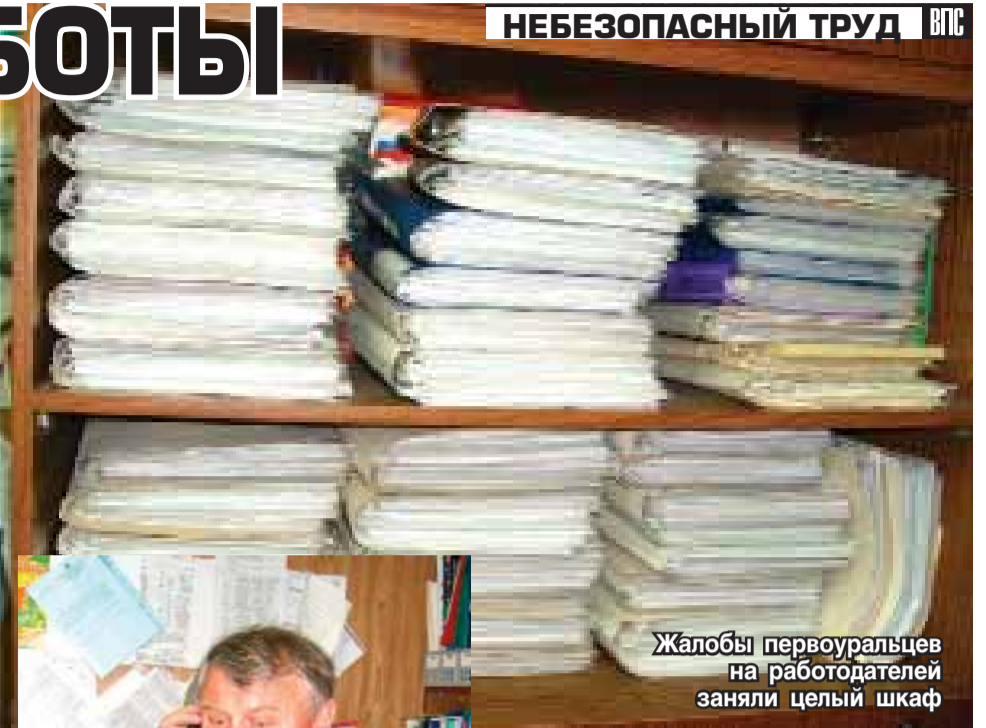
Жалобы первоуральцев на работодателей заняли целый шкаф