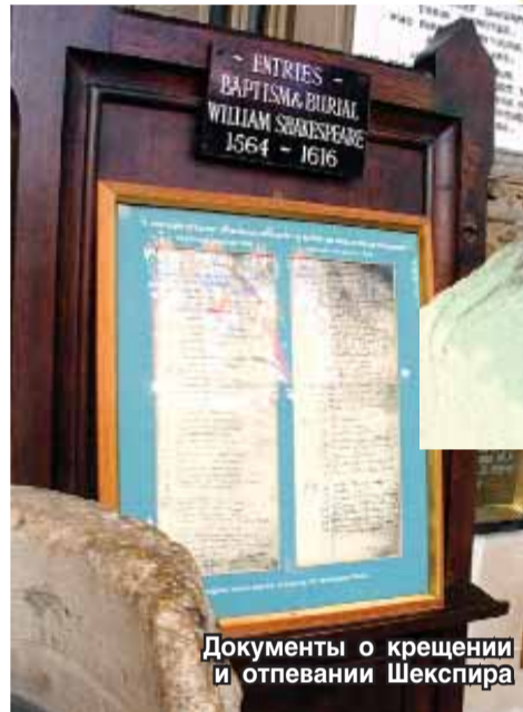
Документы о крещении и отпевании Шекспира