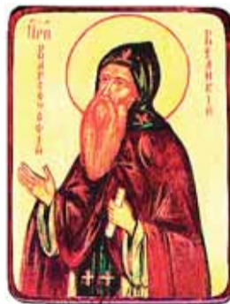
Прп. Варсонофий Великий

Напрасно некоторые легкомысленные люди думают, что если они несколько раз прочитали слово Божие, то все им уже известно и нет нужды снова поучиться. Блажен муж тот, у которого "в законе Господа воля его, и о законе Его размышляет день и ночь" (пс.1,2). Слово Божие – "книга бесконечная" по своей мудрости и глубине: чем больше читаешь со смирением и усердием, тем больше открываются тебе чудеса Божию, как в звездном небе: чем дольше смотришь на небо, тем больше видишь звезд... В семье, как и молитву, слово Божие потребно читать вслух, а по окончании чтения опять перекреститься, поцеловать и положить к св.иконам, где бы св. книга не пылилась. Совместное чтение Святого Слова утишает семейные страсти. Господь призывает: "научитесь от Меня, ибо Я кроток и смирен сердцем, и найдете покой душам вашим" (Мф.11,29).