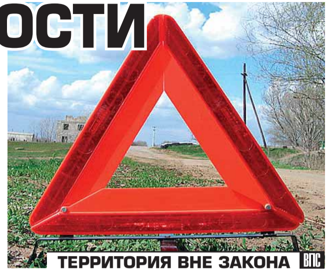
ТЕРРИТОРИЯ ВНЕ ЗАКОНА

В первом варианте зафиксировано: не убедился в безопасности своего маневра, и ничего(!) о том, что сбежал. Во втором уже отмечается: “С места происшествия скрылся”.