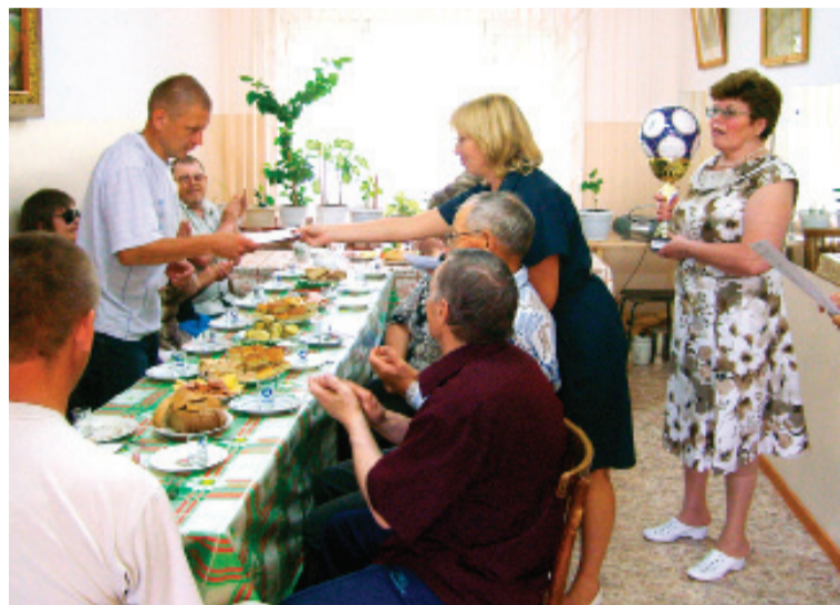
Церемония награждения спортсменов ВОС в самом разгаре

Радости членов общества слепых не было предела: первое место в городской спартакиаде среди инвалидов! Такой результат слабовидящие первоуральцы показали впервые, и эта победа праздновалась с размахом в гостеприимном офисе ВОС.