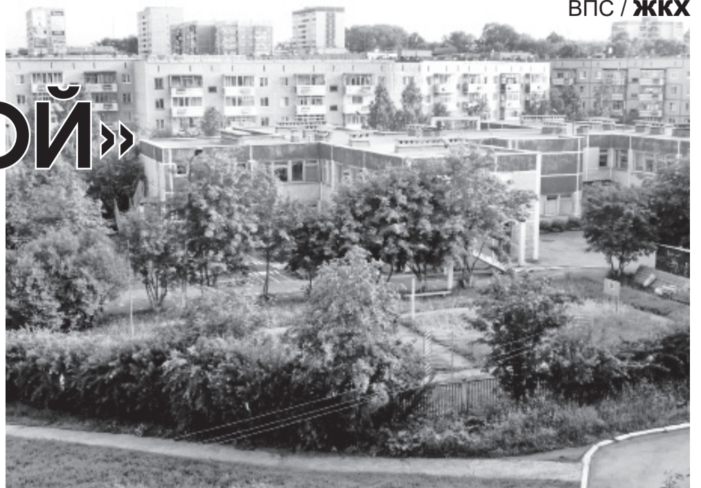
ТСЖ «Даниловское»: островок спокойствия в бурном море первоуральской коммуналки?

Принимаемые правительством РФ и министерством регионального развития «указивки», призванные упорядочить отношения между потребителем, поставщиком жилищно-коммунальных услуг и ресурсоснабжающими организациями, которые, как правило, монополисты, не дают ответов