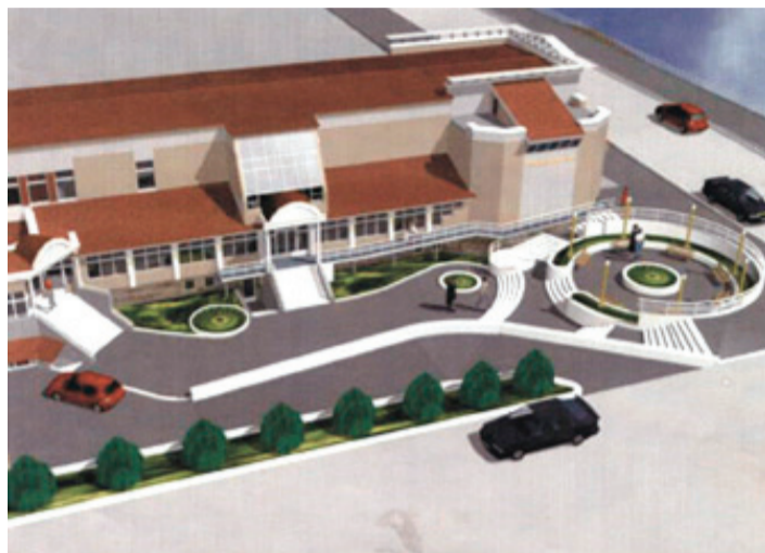
У муниципального театра «Вариант» не осталось вариантов отпраздновать новоселье в «своем» здании (на иллюстрации - так и не реализованный проект здания театра)

Следующий момент: у города много задач, которые уже нельзя не решать. Готовится проектно-сметная документация на путепровод, по предварительным расчетам на эту реконструкцию понадобится сто миллионов рублей. Стоит ли напоминать о том, что в следующем году надо заложить пару новых детских садов, хотелось бы дороги починить. Плюс скважина в Нижних Сергах – еще миллионов сорок. Да многое нужно сделать. Птицефабрика весной уведомила, что не собирается отапливать поселок. Удалось договориться о годичной отсрочке. На августовское заседание думы мы выносим вопрос о выделении денег на проектирование, а к будущему отопительному сезону необходимо поставить локальную котельную. Хорошо, если попадем в областную программу. А без областной помощи это еще миллионов десять-двенадцать.