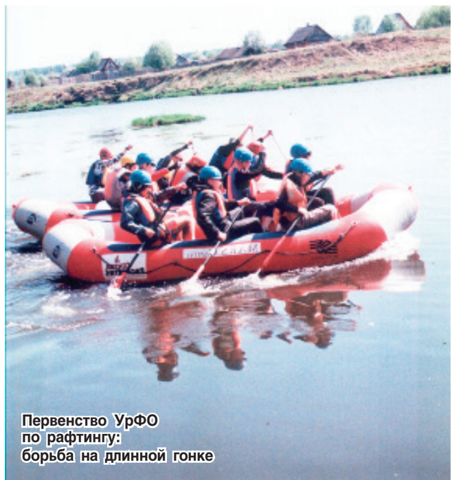
Первенство УрФО по рафтингу: борьба на длинной гонке

Говорить же о занятых местах, о результатах в соревнованиях за летний период - значит говорить об успешности детей, которые умеют трудиться, ставить цели и добиваться их. Наверное, мне везет с ними, такими современными, целеустремленными. Мы же вместе делаем единое дело - создаем будущее нашего города, а значит, России.