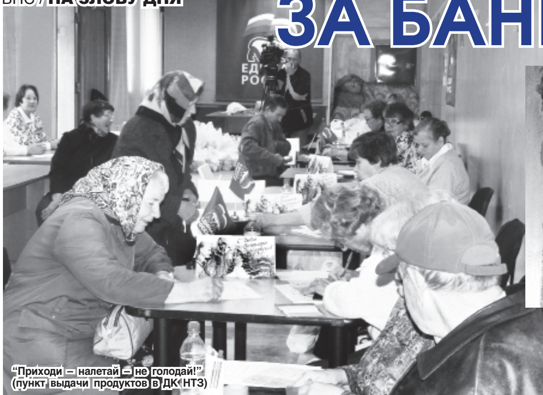
“Приходи — налетай — не голодай!” (пункт выдачи продуктов в ДК НТЗ)