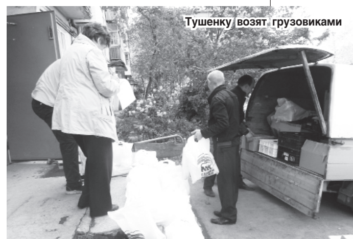
Тушенку возят грузовиками

Во как! У партии власти денег завались, тушенки тоже. Это пенсионеры наши так “замечательно” живут, что за халявным кульком риса мчатся со всех районов города и расталкивают друг друга локтями. И радуются мешку с продуктами как манне небесной. Грустно? Нет, порадуемся за стариков. Умиленные отзывы уже поступают в редакцию. В трубке слышу восторженное: “Мы хотим сказать спасибо Новотрубному заводу за продуктовые наборы! Такие наборы хорошие: масло подсолнечное, банка сгущенки, банка тушенки...” Только почему Новотрубному заводу? Стоит посмотреть на сам пакет – и понятно, кто “благодетель”. Но людям приятнее думать, что это завод о них вспомнил, а не политическая партия накануне выборов.