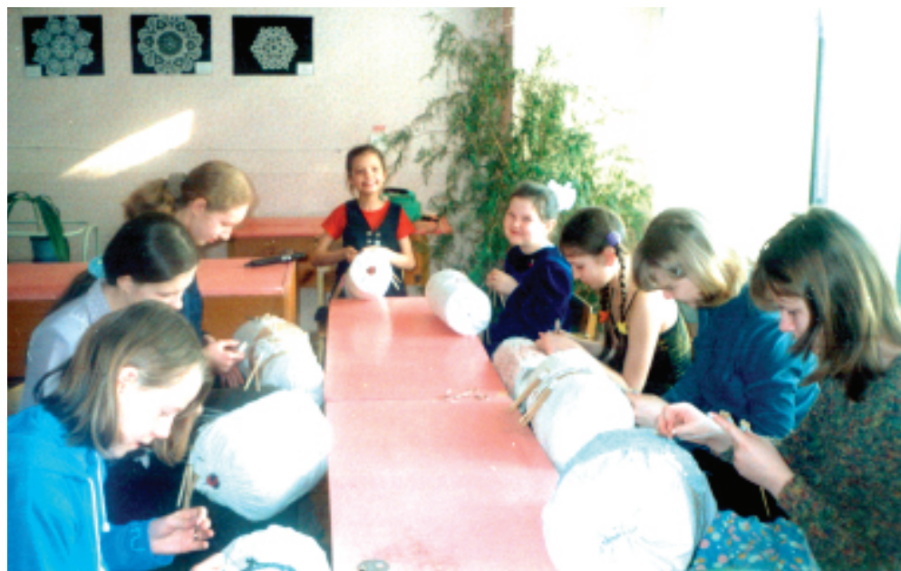
Искусство кружевоплетения - одна из «изюминок» ЦДТ

- Мы столкнулись с тем, что очень многие родители приводят к нам детишек младшего возраста. В пять лет ребенка еще почти нигде не принимают, по сути, для таких детей остаются только фигурное катание, акробатика и различные «развивающие центры», которые стоят немалых денег. Может быть, поэтому произошел наплыв