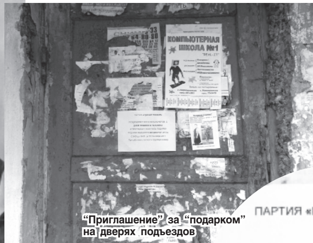
“Приглашение” за “подарком” на дверях подъездов