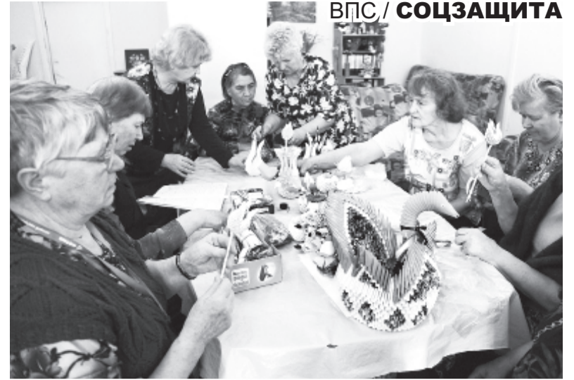
Уникальные изделия из бумаги, создаваемые руками мастериц из «Осени», известны всему городу

В распоряжении “Осени” есть отделение реабилитации инвалидов и ветеранов “Мирный” (с.Битимка), в котором отдыхают и укрепляют