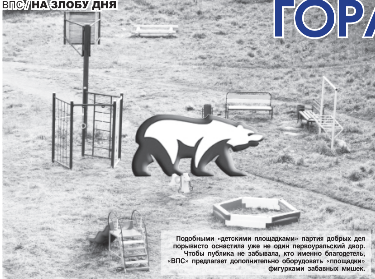
Подобными «детскими площадками» партия добрых дел порывисто оснастила уже не один первоуральский двор. Чтобы публика не забывала, кто именно благодетель, «ВПС» предлагает дополнительно оборудовать «площадки» фигурками забавных мишек.