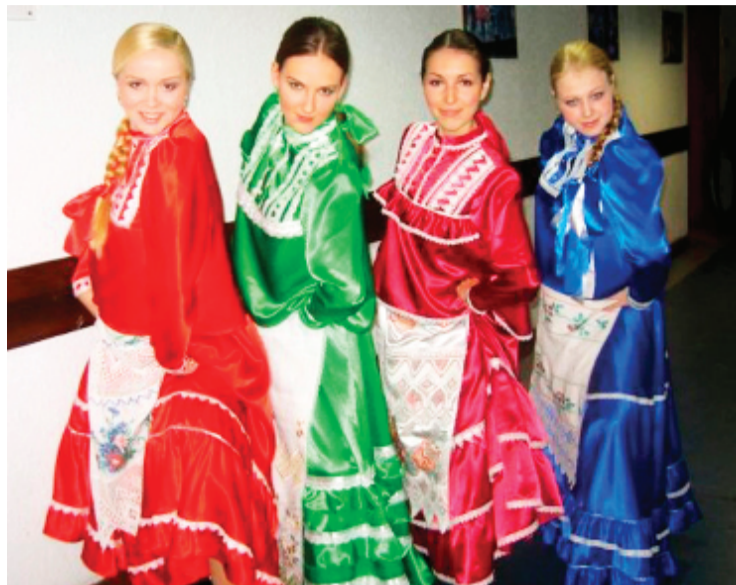
«Шайтане» - это не только аутентичный фольклор (справа - пляски на Красной площади после «Минуты славы»), но и скрупулезное следование былой «моде».

Сегодня все «Шайтане» безмерно рады подаркам и благодарны тем организациям, которые уже неоднократно помогали детям: это Первоуральское рудоуправление, «Динур», ПНТЗ, «Первоуральскбанк», ЧП «Лира», ЧП «Росавто», магазин «Товары для женщин», магазин «Юбилейный», «Товары для быта» (Динас), ОАО «Металлстройторг», магазин «Сом» и Чань-Чунь, а также нашим новым благодетелям: торговому дому «Транснеруд», «Уникому», авторемонтному заводу (п. Вересовка), мясоперерабатывающему заводу, магазину О.Г.Гольденберга, СКБ Банку, УБР и Р, сети магазинов Игоря Ковпака. Воистину права народная поговорка: «С миру по нитке - голому рубаха».