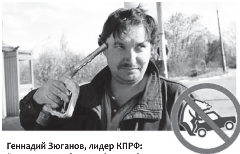
Геннадий Зюганов, лидер КПРФ: «В прошлом году за рубеж продано

До сих пор поставки на экспорт не сокращены. Прошёл месяц, ситуация на АЗС не меняется, перебои с поставкой топлива переходят из одного региона в другой. До сих пор в разных регионах страны возникают проблемы с наличием бензина и дизельного топлива на АЗС. Стоимость автомобильного топлива