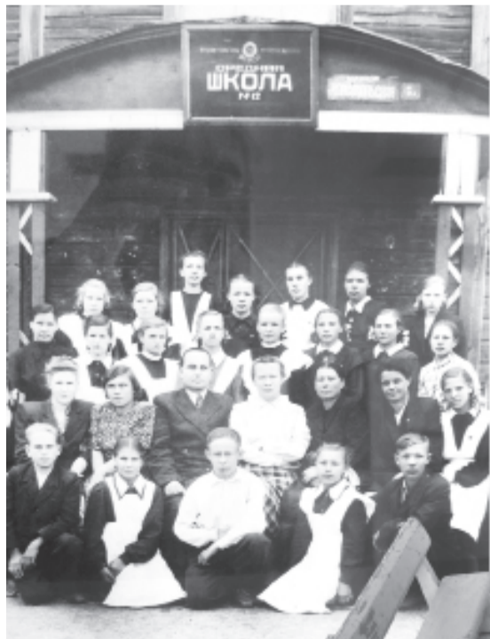
За такими партами сидели наши бабушки и дедушки

Общественное обсуждение законопроекта продлится до 5 октября 2011 года.