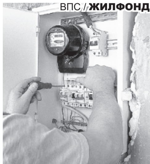
ВПС / ЖИЛФОНД

Еще одной проблемой является пользование услугами сторонних организаций при установке новой бытовой техники и приборов учета. Бесспорно, есть хорошие фирмы, но есть и такие, кто не отвечает