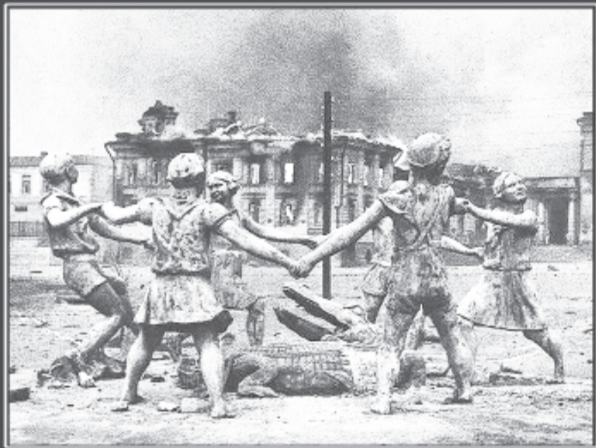
Праздник жизни Встаньте дети, встаньте в круг!