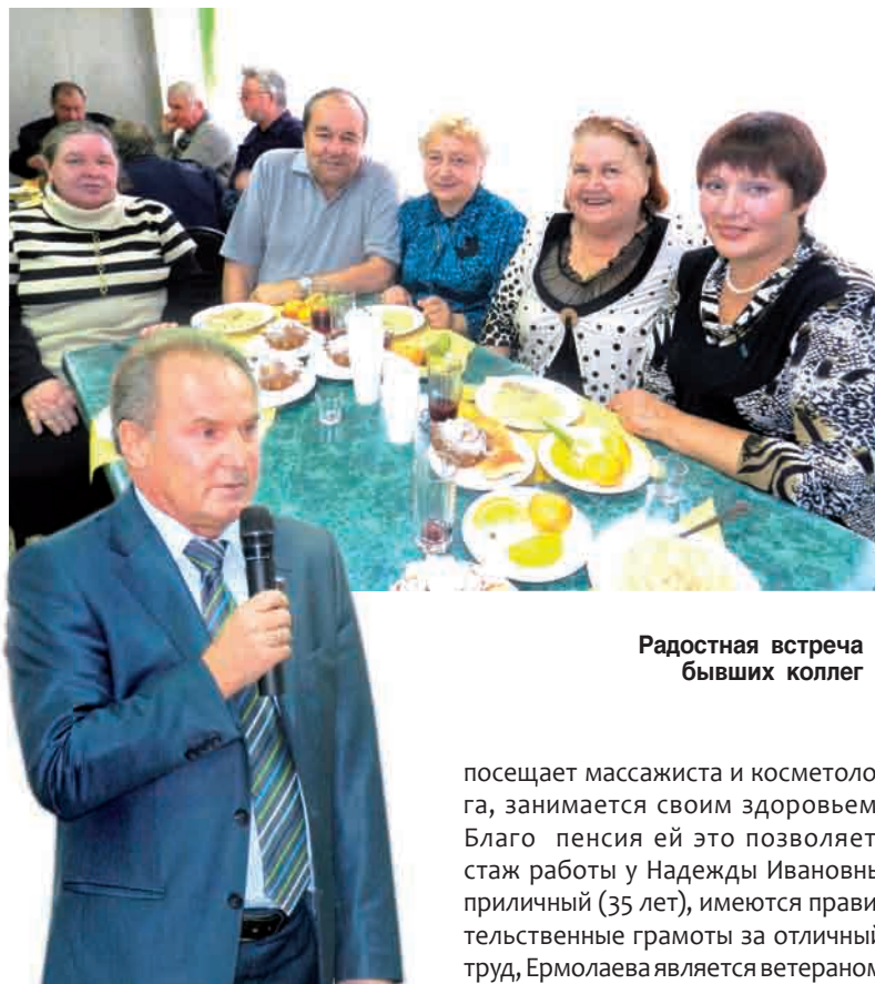
Радостная встреча бывших коллег

У всех нас растут дети, внуки – и мы должны думать об их будущем. Здесь, на базе “Уралтрубпрома”, учатся 400 студентов, у нас они проходят практику и пишут дипломы. На ЗМКК мы все заводу управление переделали под жилье для работников предприятия, сегодня уже первые двенадцать человек