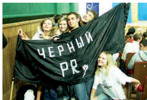
Этой теме посвящены все восемь полос формата А3. В газете критикуется и «Яблоко».