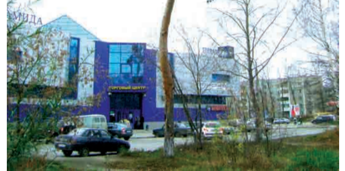
Последняя сосна на улице Трубников