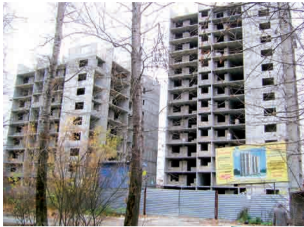
Ипотеку на рекламном щите предлагают. А вот строительство этих 16-этажек «заморозили»

А чему теперь удивляться? Это и есть последствия той самой грабительской, преступной и недаленовидной политики, которую народ метко назвал приватизацией. И о которой не любят вспоминать сегодня там, в белокаменной, - ни чужайсы, ни «двое на велосипеде».