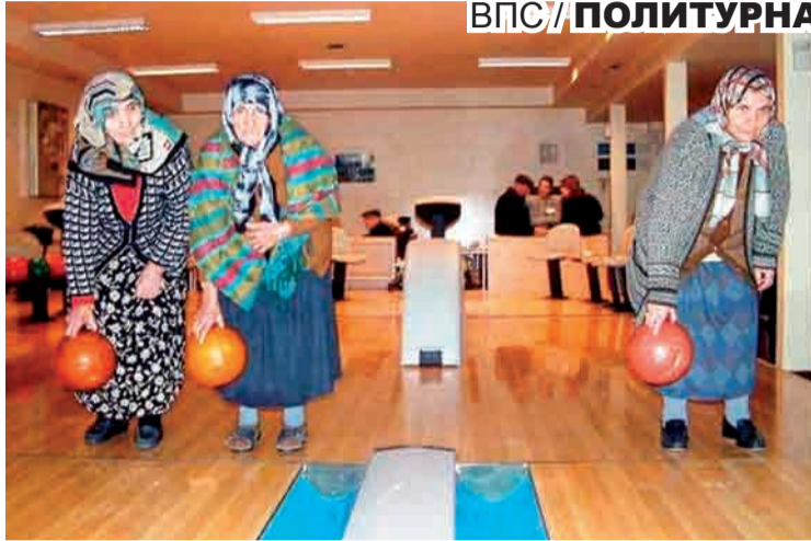
ВПС / ПОЛИТУРНА

А тем временем на языке у Артюха райская картинка: Мишарин - не Россель, который все отвергал, Мишарин - подарок для области, с ним она поднимается, богатеет, позволяет неимущим откусить от пирога. И все это стоит на законодательных задумках Евгения Петровича, которые он, пока беспартийный, но пылко поддерживающий «едросов», и дальше будет продвигать.