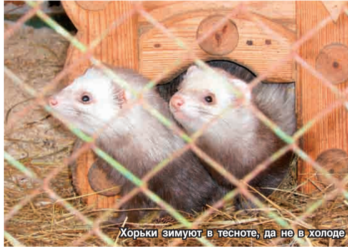
Хорьки зимуют в тесноте, да не в холоде

С животными в зоопарке все ясно: какговорится, мы в ответе за тех, кого приручили. Однако и тех зверей, которые живут на воле, человек не оставляет без внимания. И заботятся о них егеря и охотники.