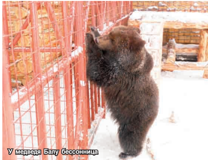
У медведя Балу бессонница