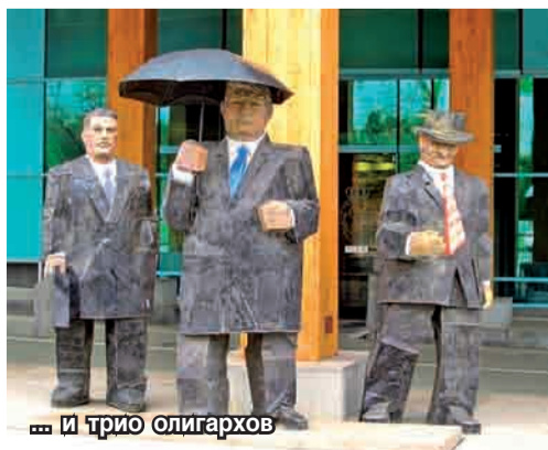
... и трио олигархов