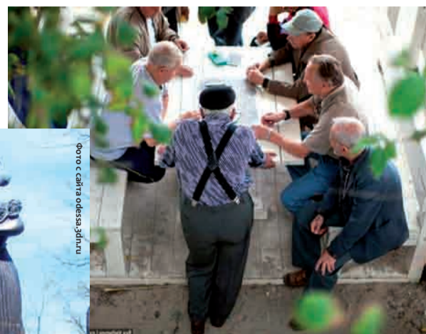
Одесса-мама и ее обитатели

Под портретом одного из претендентов на президентское кресло стояла подпись как веский аргумент: «Он знает, где скрывается коррупция!» Подумалось: да кто же этого не знает!