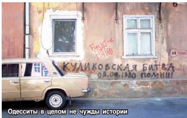
Одесситы в целом не чужды истории