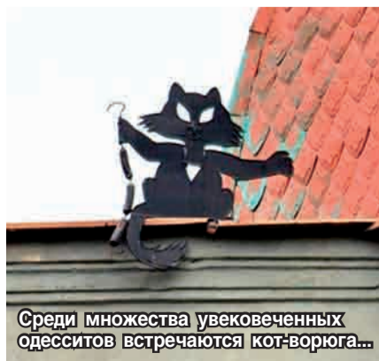
Среди множества увековеченных одесситов встречаются кот-ворюга...

В Одессе любят не всех. Юлию Тимошенко там полюбили. В разгар бархатного августа-2009 разгорячённая Одесса жила в преддверии президентских выборов. Предвыборные растяжки над городскими магистралями клеймили противников Тимошенко: они балакают - она работает, они ругаются - она делает, они - кака, она - цыца.