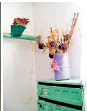
Рукотворный подъездный дизайн во всей красе