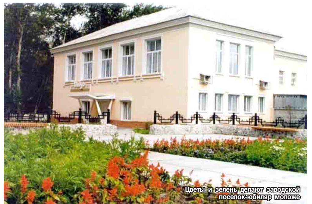
Цветы и зелень делают заводской поселок-юбилей моложе