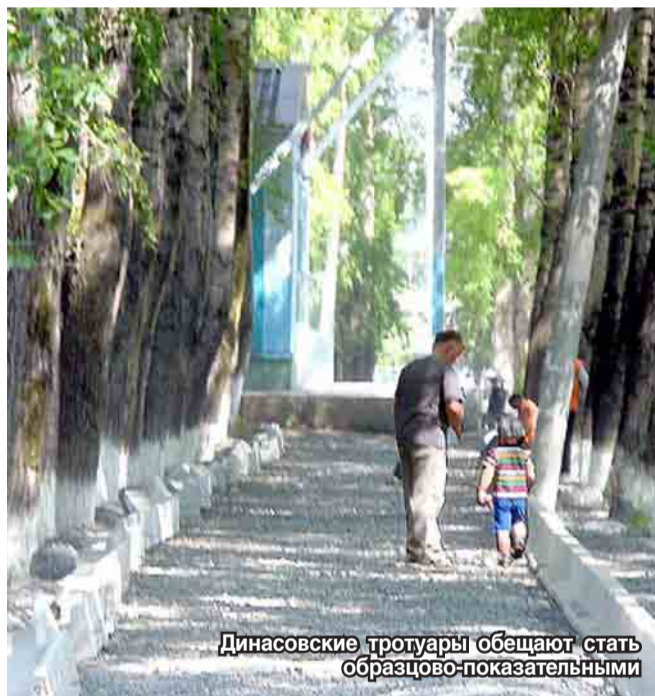
Дигуровские тротуары обещают стать образцово-показательными

До юбилея завода осталось немного. Подготовка к нему идет полным ходом. Перемены очевидны. И, в первую очередь, в благоустроительном плане. Фотоаппарат запечатлел лишь часть работ, которые ведутся в микрорайоне на средства “ДИГУРА”.