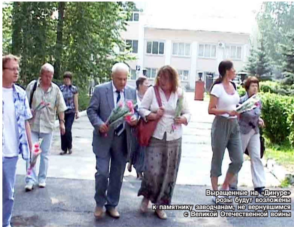
Выращенные на «Динуре» розы будут возложены к памятнику заводчанам, не вернувшимся с Великой Отечественной войны

Мировая экономика открывается, в том числе в ранее закрытой Свердловской области. На конкурсных процедурах мы как производители иногда присутствуем в единственном числе, хотя участников до полутора десятков, и все перепродавцы. Трудно конкурировать с фирмой, где два стола, три стула, компьютер, и менеджер, завозящий