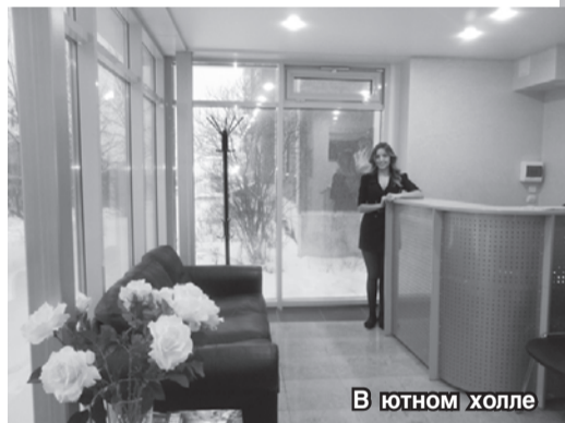
В уютном холле