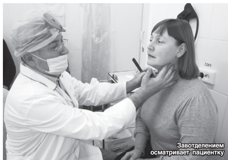
Завотделением осматривает пациентку