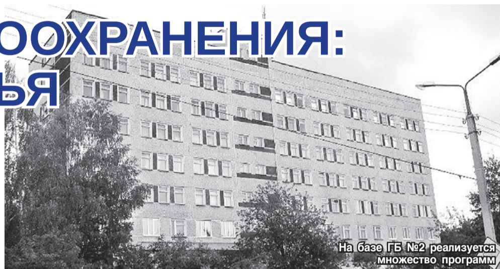
На базе ГБУЗ №2 реализуется множество программ

С целью повышения доступности медико-санитарной помощи населению во всех медицинских организациях открыты кабинеты