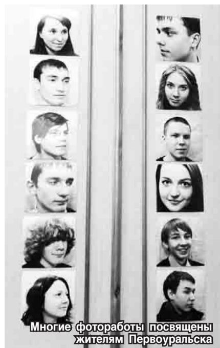
Многие фотоработы посвящены жителям Первоуральска