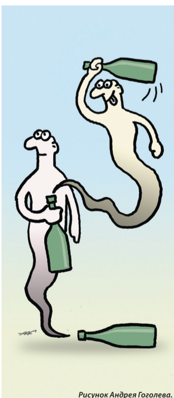
Рисунок Андрея Гоголева.

– Выполни любое твоё желание, о хозяин! – Хочу домой. – Ладно, пошли. – Ты не понял, я хочу быстро! – Ну, тогда побежали!