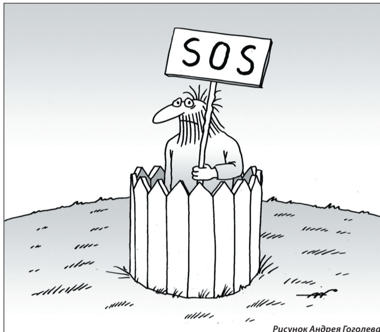
Рисунок Андрея Гоголева

Десять тысяч человек оказались один на один с трудностями, осложняющими их жизнь. В другие городские районы ежедневно должны выезжать до пяти тысяч человек – работающих на предприятиях, школьников и студентов. Для них увеличился путь с 10 до 35 километров, время проезда с 10 минут до одного часа, а его стоимость – с 12 до 40 рублей. Количество рейсов маршрутных такси и муниципального транспорта значительно уменьшилось: автобус №17 приезжает на Старатель