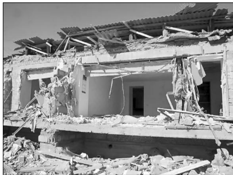
Это не последствия теракта, а офис ООО «СТС» через несколько минут после начала погрома.

Проще говоря, проигравшее битву с местным административным ресурсом руководство «СТС» попросило суд о последней милости – дать отсрочку на год для цивилизованного демонтажа строений. Для положительного решения вопроса нужно было лишь предоставить несколько необходимых документов. Мэрия при этом имела