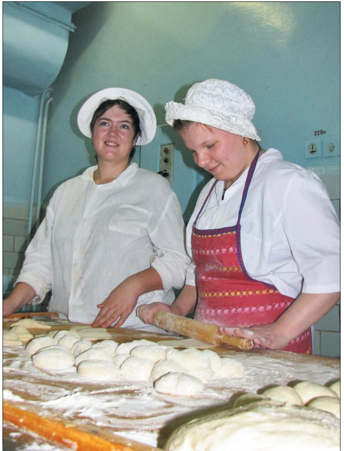
«Хлебопеки» Автор Галина Соколова.