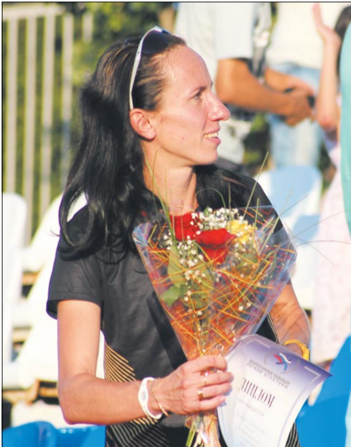
«Чемпионка мира тагильчанка Мария Савинова принимает поздравления»