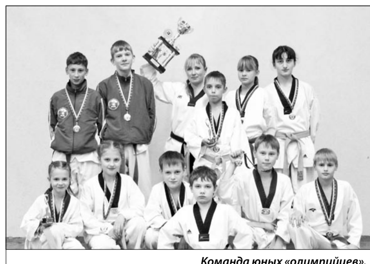
Команда юных «олимпийцев».