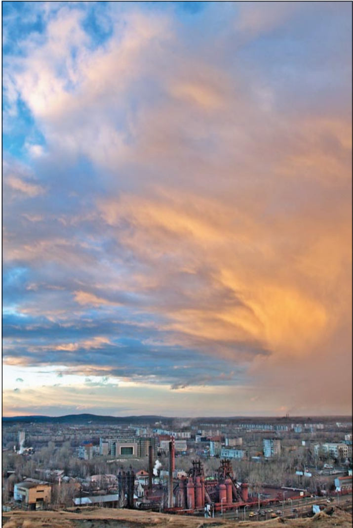
«Небо над Тагилом». Автор Андрей Гоголев.