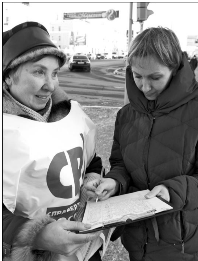
Сбор подписей под обращением Справедливой России «Понизим тарифы ЖКХ по закону!». Нижний Тагил, ул. Газетная, 21.2.2012 г.

Самой «больной» является тема низкого качества оказываемых тагильчанам жилищно-коммунальных услуг и постоянный рост цен на них. «Справедливая Россия» в Нижнем Тагиле начинает акцию «Понизим тарифы ЖКХ по закону!». Начало акции – обращение к региональным властям с требованием прокурорской проверки этой сферы жизни города и сбор подписей под этим письмом.