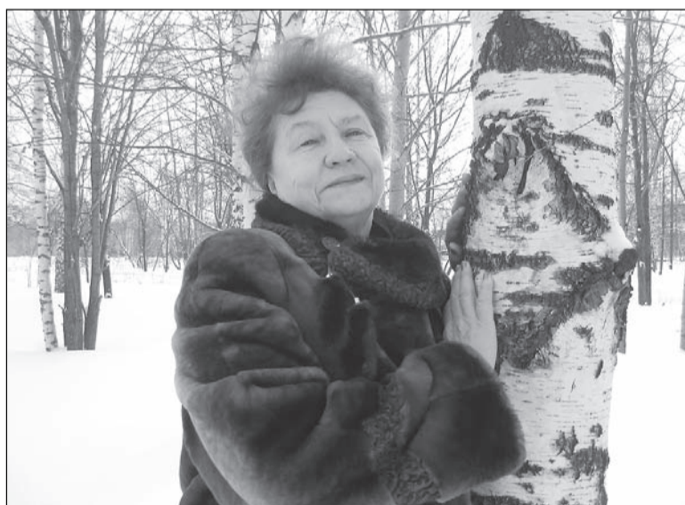
С песней по жизни.

– Когда пою, то чувствую прилив сил, вдохновение, – улыбаясь, говорит она. – Я хочу, чтобы у каждого, кто придёт на наш концерт в воскресенье, было хорошее настроение, чтобы салдинцы верили в будущее и в соб-