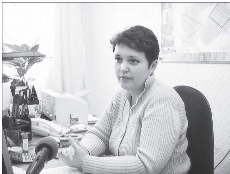
Голосуйте сами, не отдавайте свой голос другим.

– Да, такая ситуация по всей области. Если смотреть статистику, то в этом году избирательными объединениями подготовлено 86 видов агитационных печатных материалов. Это гораздо меньше, чем в прошлые выборы. В Нижней Салде распространяется менее 20 этих видов, но агитационные материалы всех партий в Нижней Салде присутствуют, проводятся встречи с кандидатами. Нарушений пока не зарегистрировано.