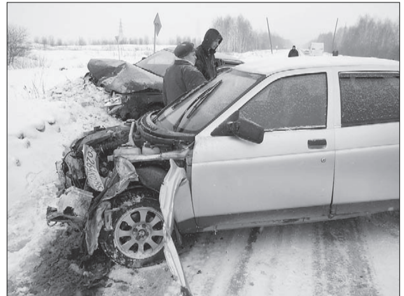
Восстановлению не подлежит.

Около 9-ти часов утра во вторник на выезде из Нижней Салды столкнулись два легковых автомобиля и автобус. ДТП инициировал пьяный водитель такси.