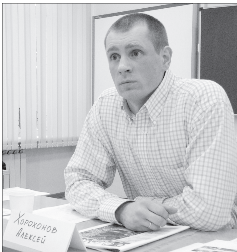
Пора брать инициативу на себя.

На первом организационном собрании, которое состоялось 4 марта, уже набросали черновые планы – отреставрировать корт в районе «китайки», установить