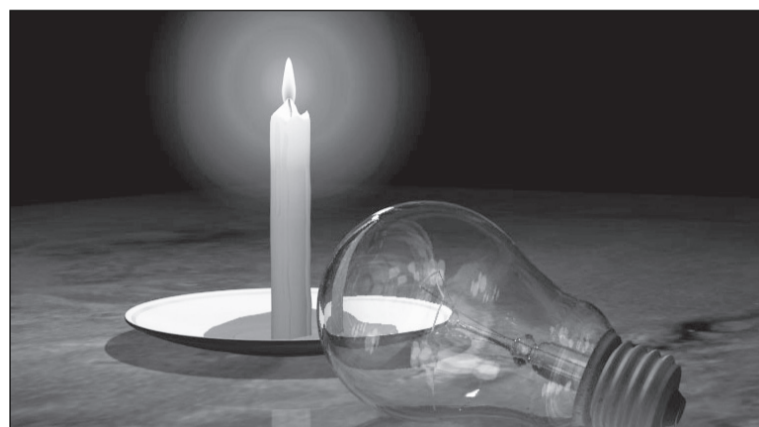
Меняем лампочки на свечи.

Ответьте, на каком основании с жителей общежития по Фрунзе 137А будут ежемесячно взимать плату за электроэнергию общего пользования в размере 109 руб. с человека? Если нас прописано трое, то получается, что мы будем жить в коридоре, ведь за свет в комнате заплатим в три раза меньше?