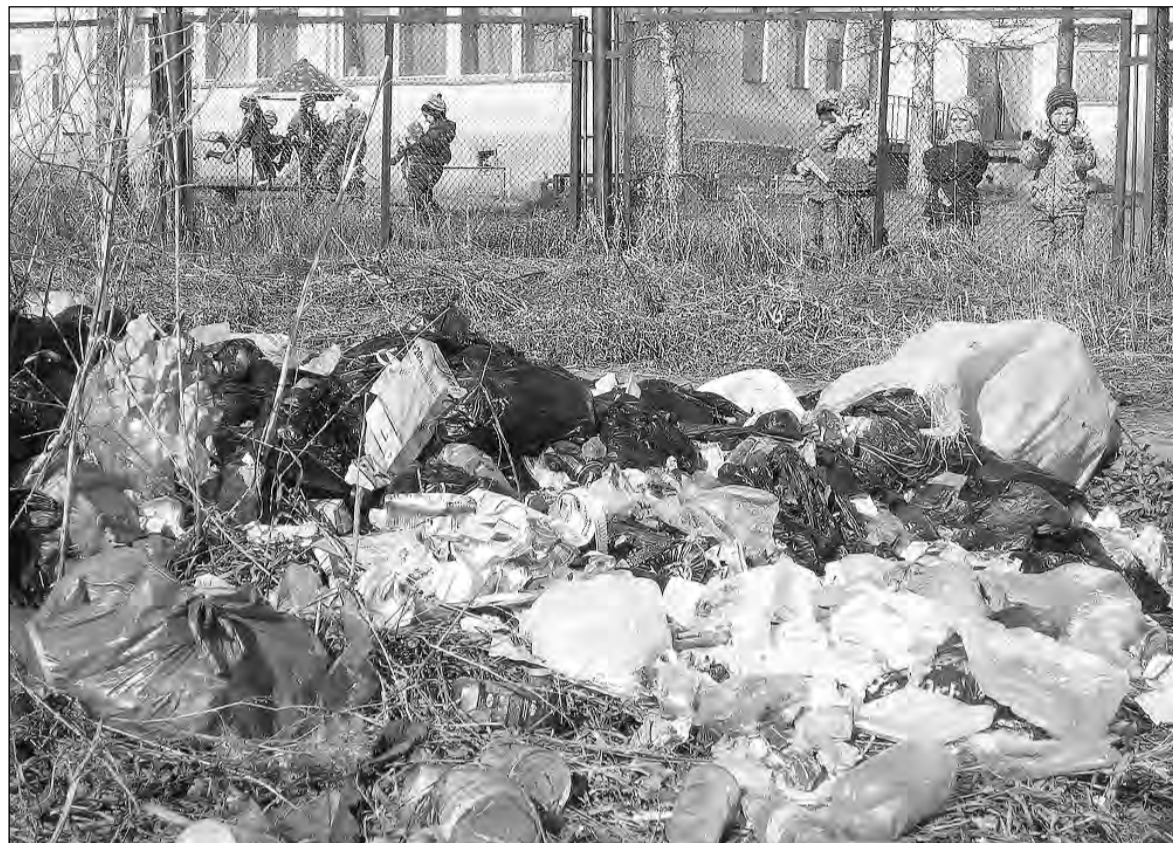
Дети «Калинки» спрашивают: - Люди, вы люди или ..?

Городская санитарная комиссия начала поквартально объезжать город и собирается нещадно штрафовать за беспорядок и предпринимателей, и рядовых граждан.