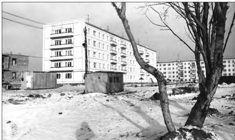
Только что заселённый дом 38 по ул. Строителей.

Если в вашем семейном альбоме есть интересные фото молодой застройки Салды или редкие фотографии со старинными зданиями, которых уже нет, приносите их в редакцию. Построим город заново из фото-кирпичиков!