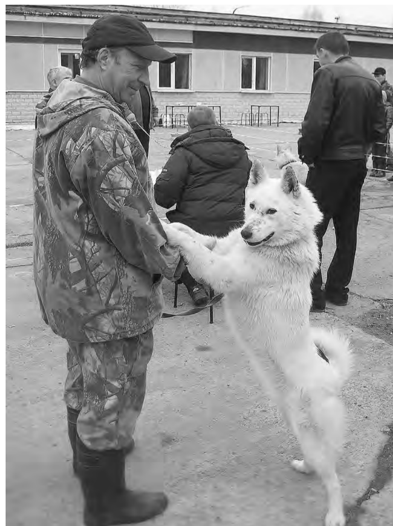
– Дай, друг, на счастье лапу мне!

Салдинских лаек и гончих оценили эксперты из области. В минувшее воскресенье состоялась 39-я Районная выставка охотничьих собак.