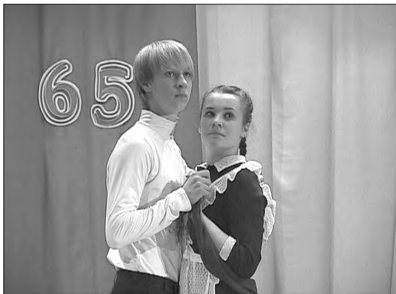
Первый школьный вальс, прерванный войной.

Фестиваль детского творчества «Весенняя капель» продолжил традиционный конкурс вокальных и хореографических номеров. Все выступления детей посвящены 65-летию Победы.