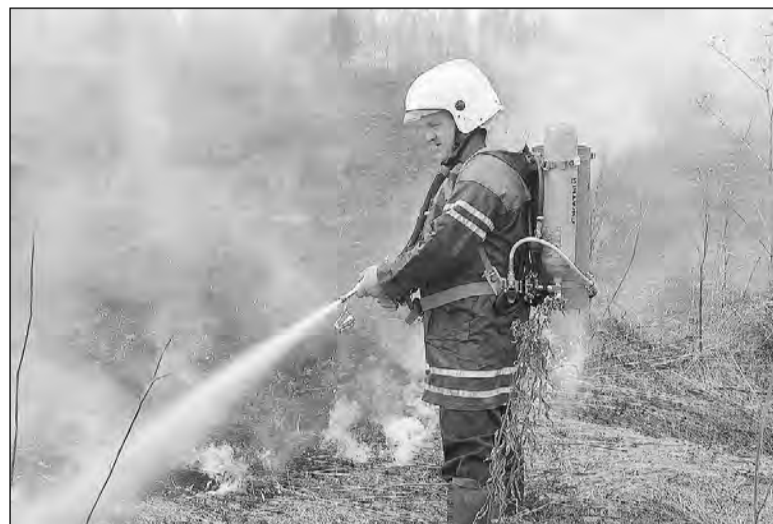
У пожарных наступила горячая пора.