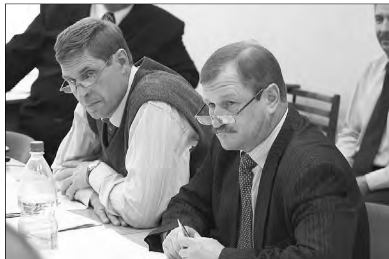
Весной уже думают о зиме.

На основании Федерального закона от 06.10.2003 № 131-ФЗ «Об общих принципах организации местного самоуправления в Российской Федерации», статьи 23 Устава городского округа Нижняя Салда, в соответствии с Положением «О порядке установления и регулирования тарифов (цен) на услуги, предоставляемые муниципальными предприятиями и учреждениями, организациями жилищно-коммунального комплекса городского округа Нижняя Салда».