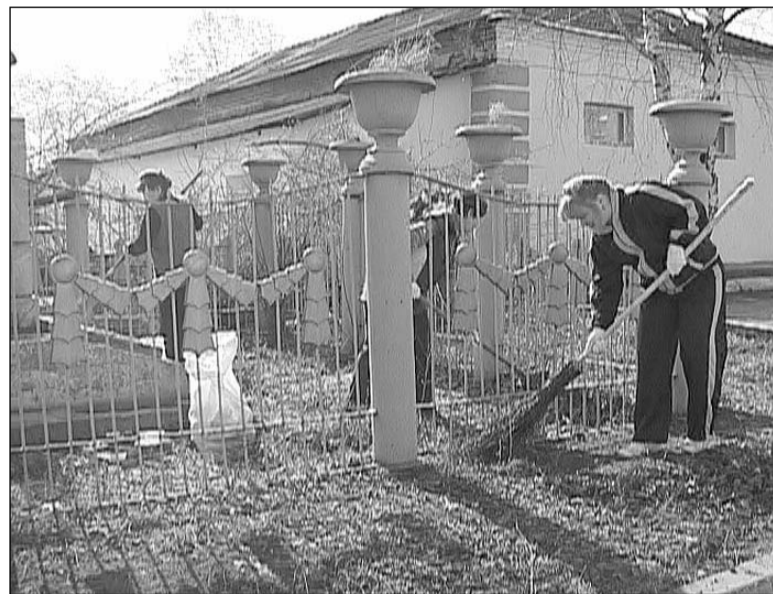
Пятничный субботник у администрации города.