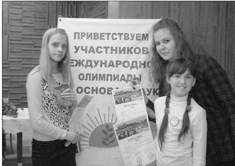
Салдинцы в Праге.