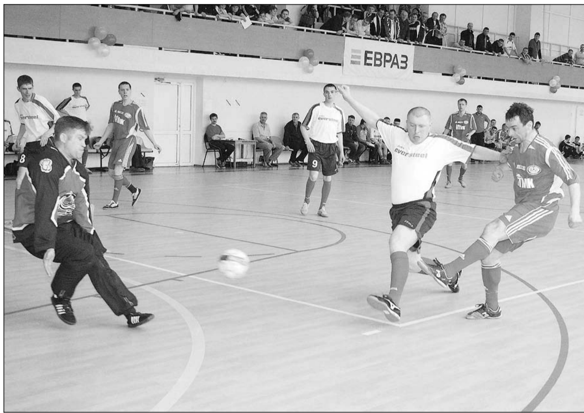
Футболистам НТМК было не догнать НСМЗ

И вот все игры позади. Команда НСМЗ стала обладателем почётного титула и переходящего кубка. Второе место заняли футболисты НТМК, третьи – КГОКа. Отдельные игроки были номинированы на звание лучшего