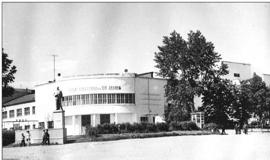
Площадь Свободы, 70-е годы.

Если в вашем семейном альбоме есть интересные фото молодой застройки Салды или редкие фотографии со старинными зданиями, которых уже нет, приносите их в редакцию. Построим город заново из фото-кирпичиков!