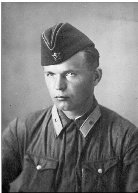
Весточка о командире лыжной бригады пришла только в 2009 году.