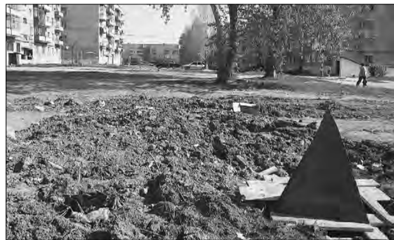
Непроходимый участок у д.52 по ул. Строителей.

Из 102 предписаний о ликвидации свалок мусора, приведения территорий в первоначальный вид после раскопок, не выполненными остались 14.