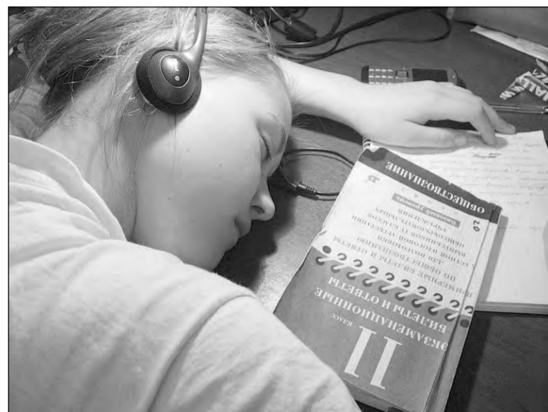
Покой нам только снится.

Для качественной подготовки к ЕГЭ по конкретному общеобразовательному предмету можно воспользоваться услугами сервиса «Пробный ЕГЭ он-лайн», сайт http://exam.ege66.ru . На сайте размещена публичная оферта для физических лиц. Стоимость услуг – от 100 рублей (1 предмет с автоматизированной проверкой частей А и В) до 2000 рублей (5 предметов с проверкой части С экспертами). Особенно этот вариант подготовки должен заинтересовать выпускников прошлых лет, тех, у кого не было возможности пройти бесплатное репетиционное тестирование.