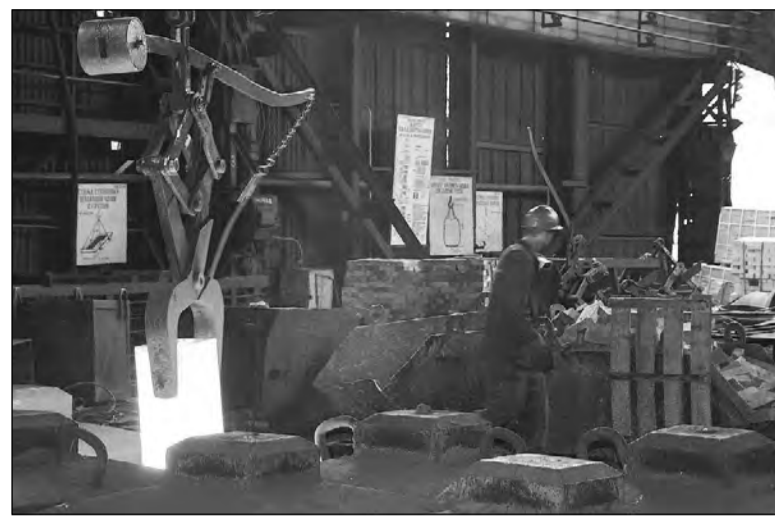
Цель программы - загрузить прокатный цех.

Сейчас руководство НСМЗ и НТМК добивается реализации на предприятии ещё одной программы развития – загрузки прокатного цеха. Однако оборудование цеха устарело много лет назад. Предлагается строительство новой нагревательной печи. Уже выполнено техническое за-