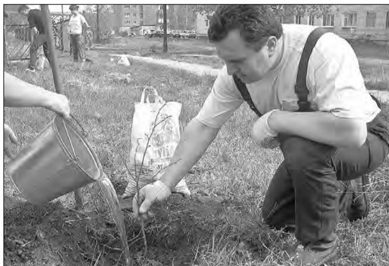
Начало аллеи положено.