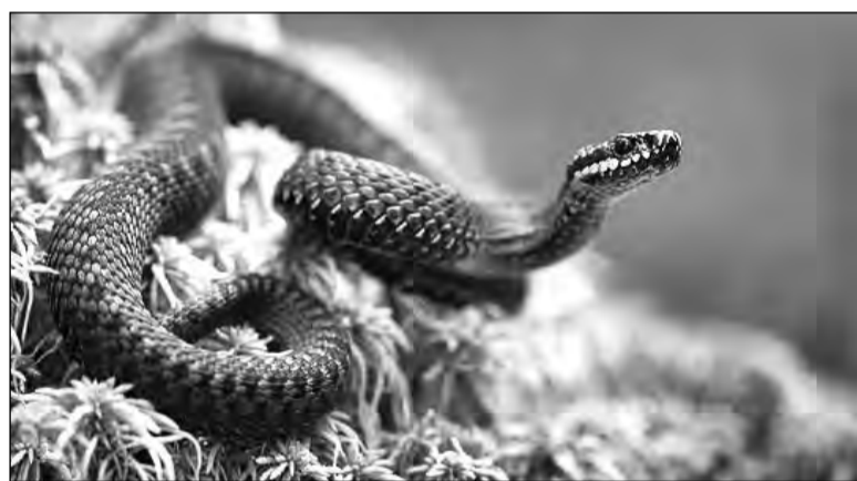
Яд «наших» гадюк не смертельно опасен.

Рыбалка в посёлке Басьяновский для салдинца закончилась на больничной койке.