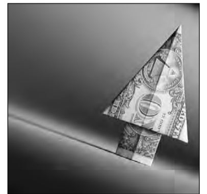
Зарплата на старте.

Уже три года мы увеличиваем зарплату индивидуально только тем, кто действительно работает на благо производства. И наступивший кризис показал, что это правильная политика. Так как на нашем