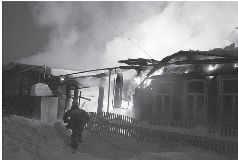
Дом уже не спасти.

Тушить разъярённое пламя приехали три пожарные машины. Заправляться водой пришлось ехать в часть. Опытные пожарные утверждают: если дом загорелся, его уже не спасти. Получается, что их главная задача – не дать огню перекинуться на соседние дома. В этом им помогли жители улицы. Хозяин соседнего дома находился на работе, чтобы уберечь его жилище,