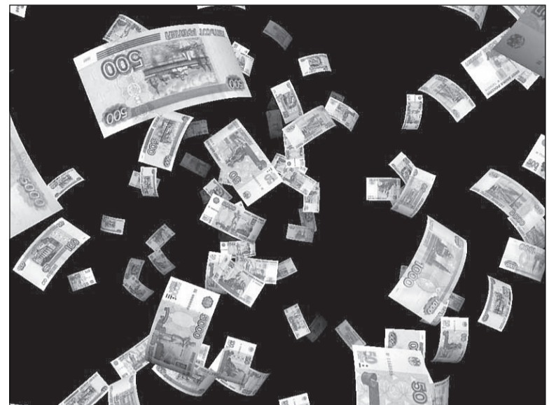
А годы летят ... как деньги.

В 17 российских регионах, в том числе и в Свердловской области, с 2010 года начнётся эксперимент по утилизации автомобилей отечественного и импортного производства старше 10 лет. При сдаче машины в утиль потребитель получит сертификат номиналом 50 тысяч рублей, который может быть