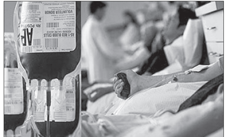
Спасая других, помогаешь себе.

Хочу стать донором, но не знаю, что для этого нужно.