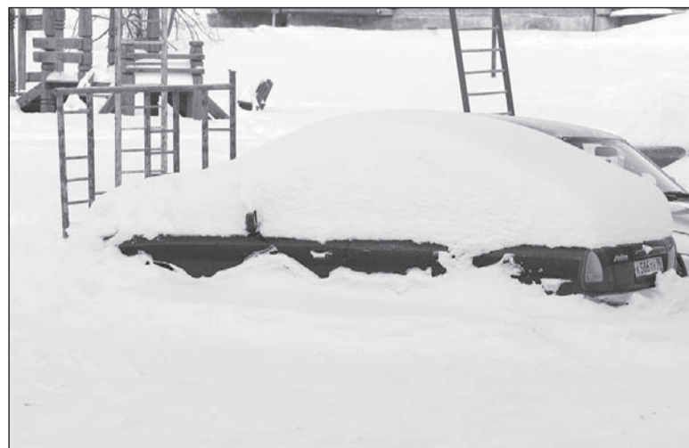
Верная примета зимы-2010.

Для борьбы с мусорными завалами у контейнеров на подмогу новому мусоровозу прибыла