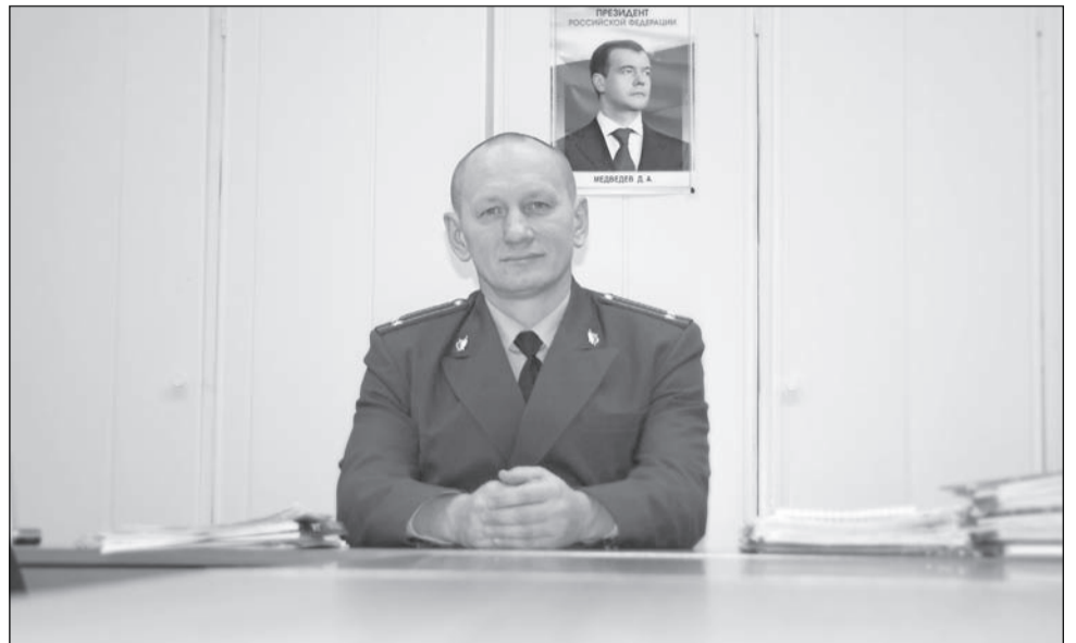
Год отличился стабильностью.

– Было установлено 2 факта незаконной рубки елей, ещё 4 поступили уже в этом году. За многочисленные нарушения оштрафовано руководство асфальтобетонного завода, учреждённого ООО «Магистраль». На предприятии отсутствовал какой-либо контроль за выбросами в ат-