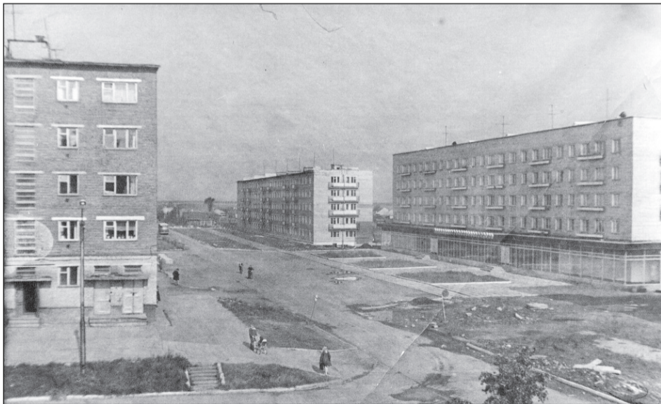
Фото сделано из окна дома №46 по ул. Ломоносова. Нет ни деревьев, а главное – домов, продолжающих ул. Ломоносова

Если в вашем семейном альбоме есть интересные фото молодой застройке Салды или редкие фотографии со старинными зданиями, которых уже нет, приносите их в редакцию. Построим город заново из фото-кирпичиков!