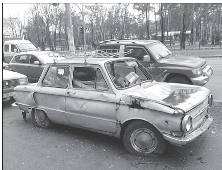
И тыква превратится в карету.

8 марта этого года в Свердловской области стартует программа по выкупу старых машин.