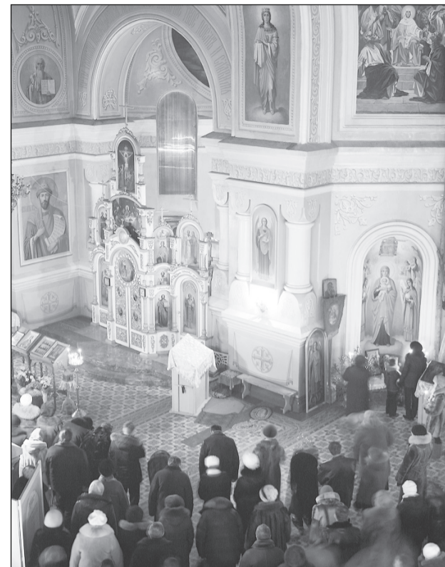
Сотни салдинцев побывали на ночной службе.