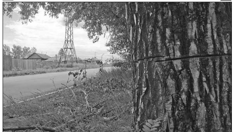
Подсечённый тополь – не один на улице.

На пересечении улиц Энгельса и Луначарского мы будем выпиливать тополя, которые находятся под линиями. Намечена их реконструкция, – сообщили в Горэлектросетях. – Тополя, о которых говорится в сообщении, не подпилены, а подсечены. Подсечка делается, чтобы деревья не росли ещё выше. И, скорее всего, это сделали жители близлежащих домов. Те деревья, что в стороне стоят – хозяйство уже не наше.