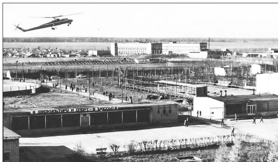
Спорткомплекс "Вымпел", 1987 г.

Если в вашем семейном альбоме есть интересные фото молодой застройки Салды или редкие фотографии со старинными зданиями, которых уже нет, приносите их в редакцию. Построим город заново из фото-кирпичиков!