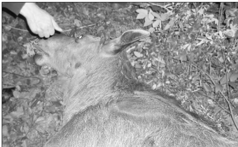
Животное получило травмы несовместимые с жизнью.