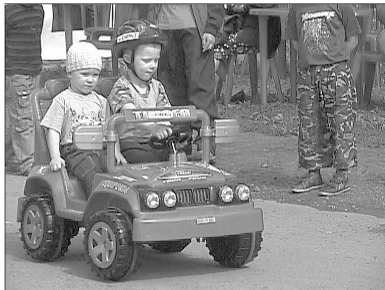
А я сяду в кабриолет.

– Там проходит много коммуникаций, и в случае аварии восстановить городок будет трудно, лучше мы его возведём на участке ул. Строителей, 1, где нет коммуникаций, – говорит глава ад-