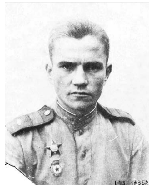
Уже два года на фронте, 1943 г.

Простите, что не пишу вам. Но писать нечего. Сейчас понять трудно, кто