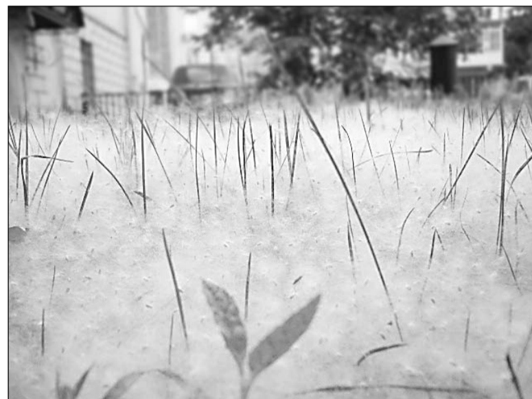
Снег в июне.

А сотрудники МЧС по Свердловской области обращают внимание автомобилистов на тополиный пух. Он может причинить автомобилю немалый вред, особенно, если в машине есть кондиционер. Сор, мельчайшие камушки и даже осколки разбитых автомобильных стекол, вылетающие из-под идущего