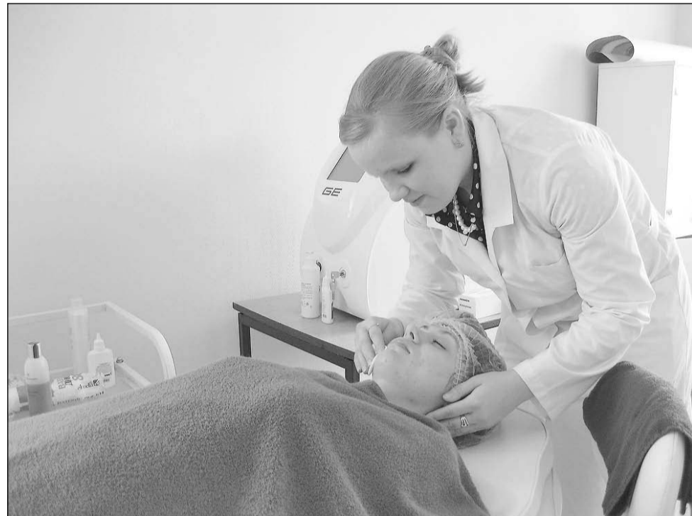
Чувствовать себя обновлённым.