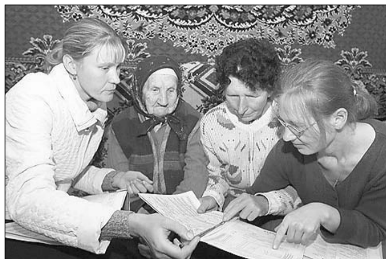
Без вас картины не будет.

Продолжается набор временных переписных работников. Желающим можно обращаться в отдел статистики: ул. Ленина, 21 или по телефону 3-12-77.