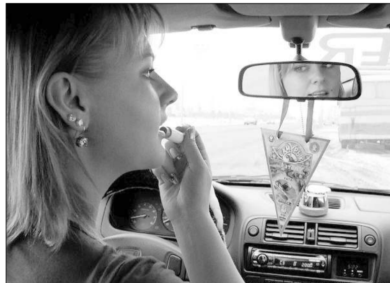
Красота за рулём - страшная сила.

Екатеринбурженку привлекли к административной ответственности – штраф в 2,5 тысячи рублей. О возмещении материального ущерба дело будет решаться в суде. По словам очевидцев, обе машины получили серьёзные механические повреждения.