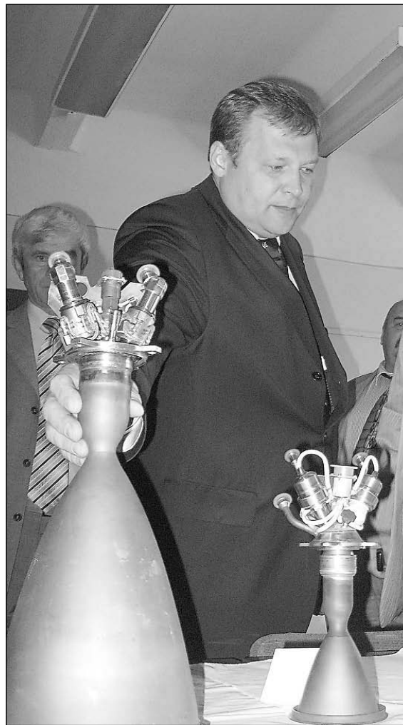
Наши двигатели министру понравились.