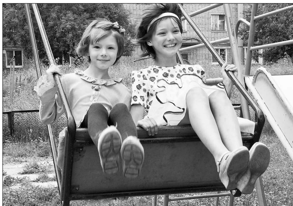
Только небо, только ветер, только радость впереди...