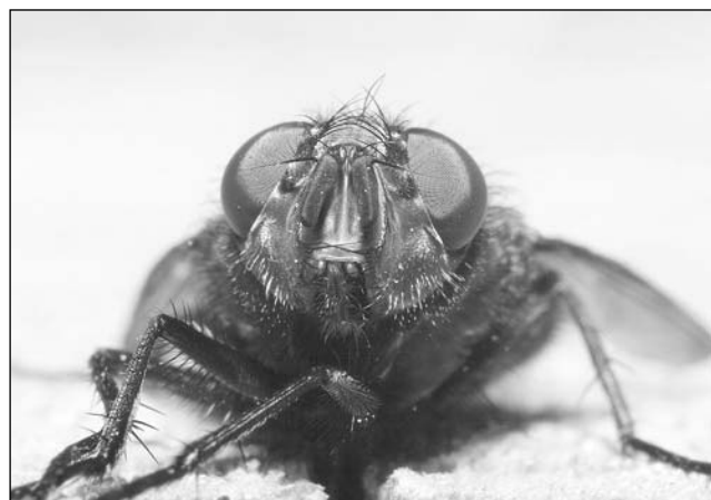
Навозные мухи изводят соседей.

В редакцию обратились жители улицы Володарского, уставшие от навозных мух и других производных частного фермерского хозяйства.