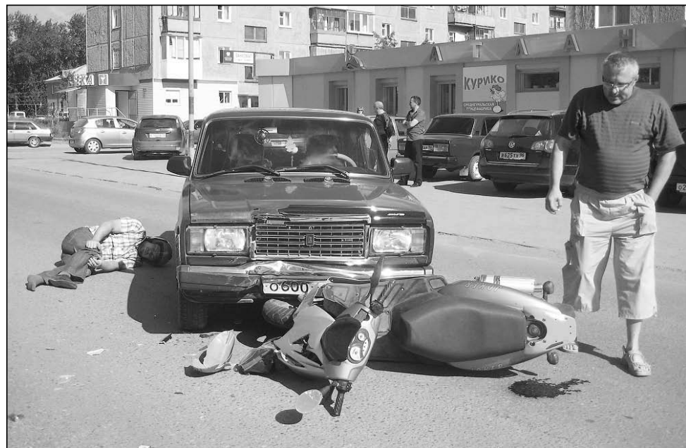
Скутериста подмяло под колёса «семёрки».