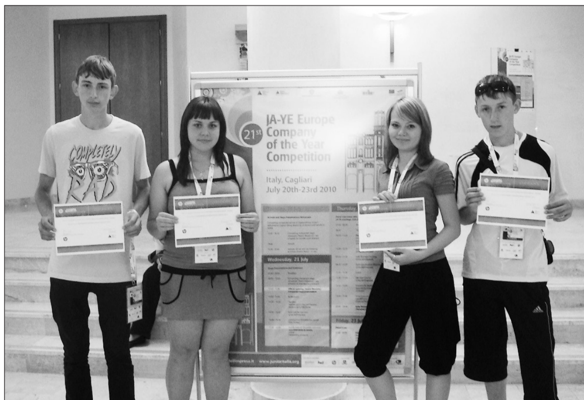
Для идей салдинского бизнеса нет границ.

Поездка для некоторых участников бизнес-клуба – это