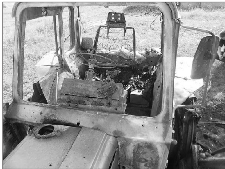
Сгорел, увы, не на работе.

Около четырёх часов утра 29 июля на улице Малютина загорелся трактор.