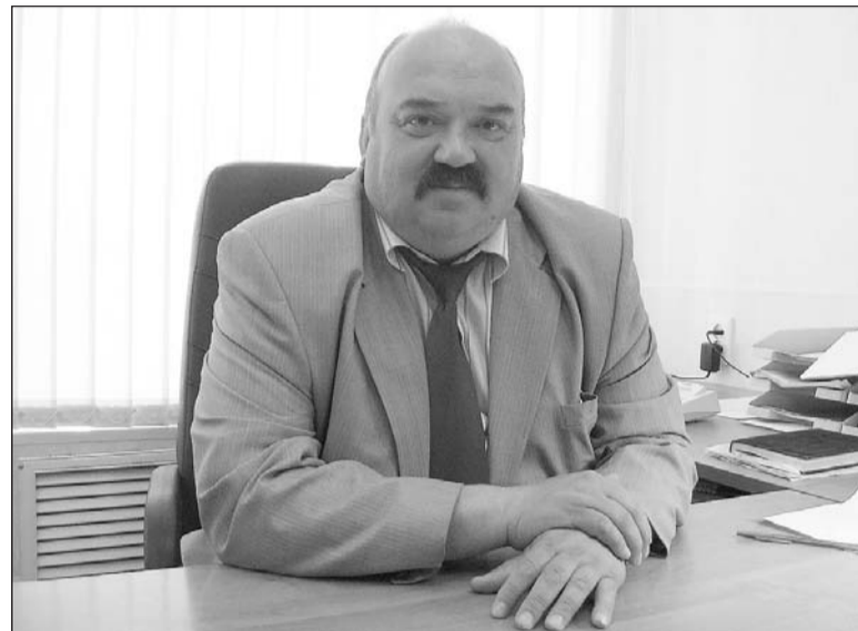
Строитель по профессии и по призванию.

– К сожалению. У нас нормальными темпами ведётся индивидуальное строительство, оформляются земельные участки под строительство производственных цехов, коммерческих объектов. А вот строить многоквартирные дома пока у нас никто не решает. Даже несмотря на то, что мы предлагаем подготовленные участки для застройки, обустроенные необходимыми инженерными коммуникациями. У инвесторов нет уверенности, что их вложения окупятся. Таким городам, удалённым от центра области, как наш, нужна государственная программа. Возводится