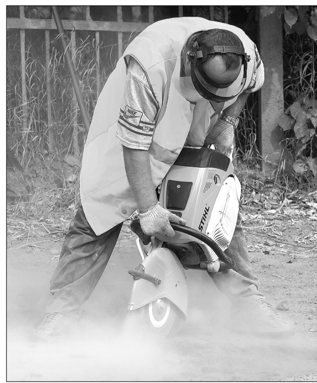
Бензорез «Штиль» в работе.