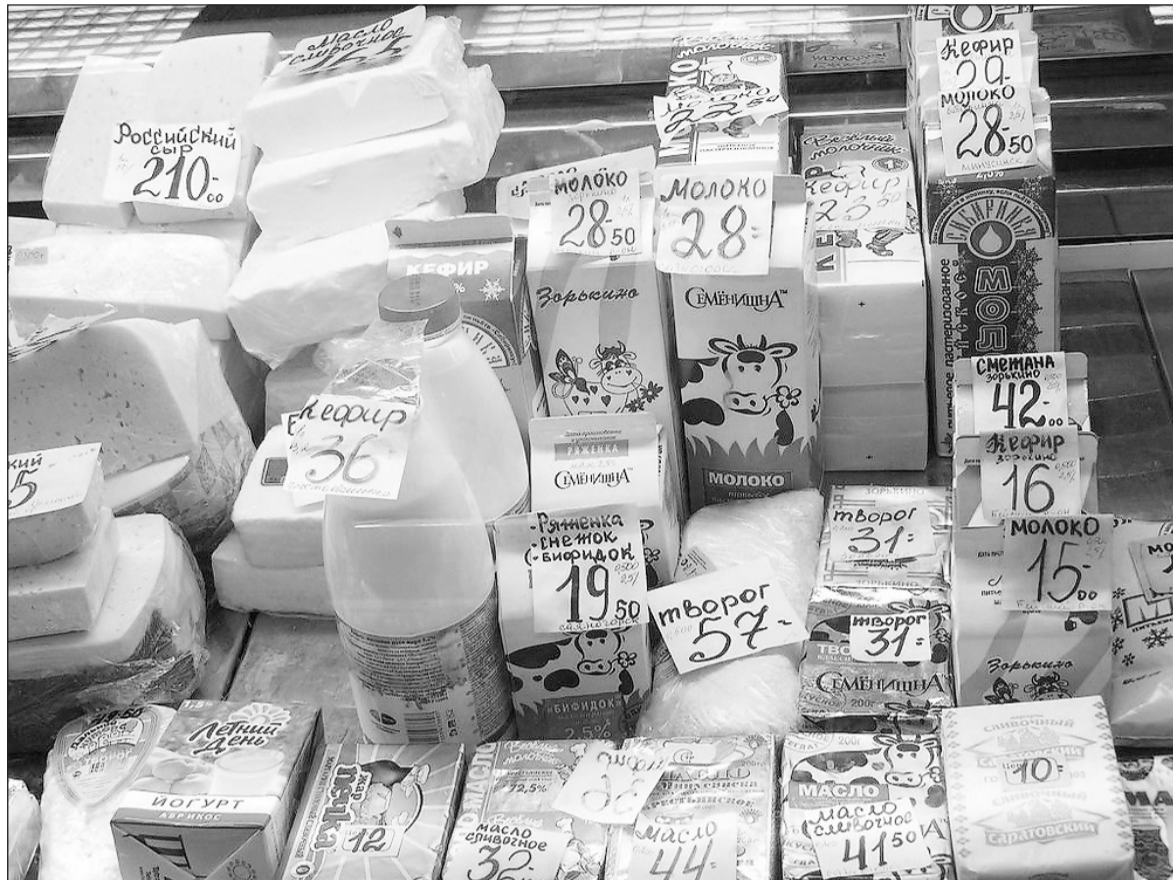
А молоко-то створожилось!