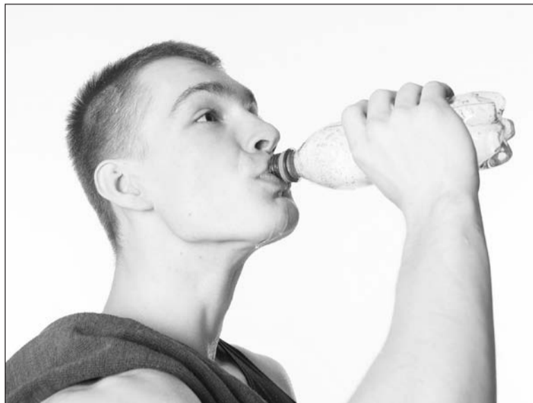
Даже минералку надо уметь пить!

– В сутки человек должен потреблять 20-40 мл жидкости на килограмм массы тела. Вода не должна быть холодной, чтобы исключить ещё и простудные за-