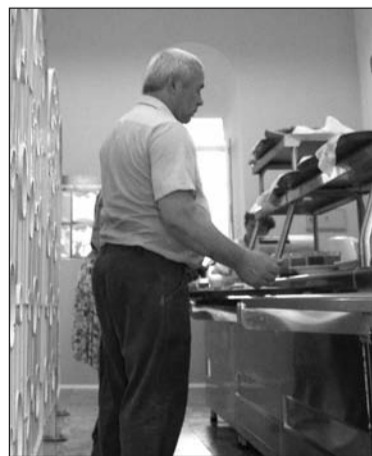
Что бы съесть, чтобы не отравиться.

При проведении социально-гигиенического мониторинга качества кулинарной продукции и салатов в предприятиях общественного питания ООО «Корпус Групп Урал» (столовые № 1, 5, 10 на территории НСМЗ), выявлено, что с начала 2010 года из 22 исследованных проб, 13 проб (59%) не отвечают по микробиологическим показателям требованиям санитарных правил. Наибольший процент (до 90%) неудовлетворительных проб приходится на салаты.