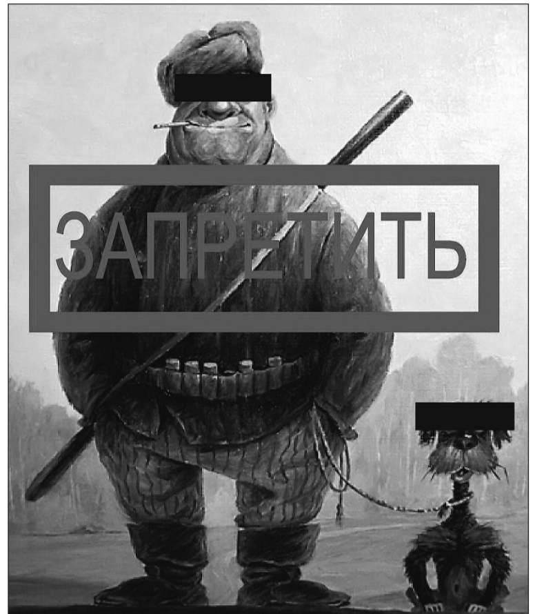
Охотники, сидите дома.

Скажите, отменили ли запрет на посещение лесов? Можно теперь ехать на рыбалку на Басьяновку? И когда будет открыта охота?