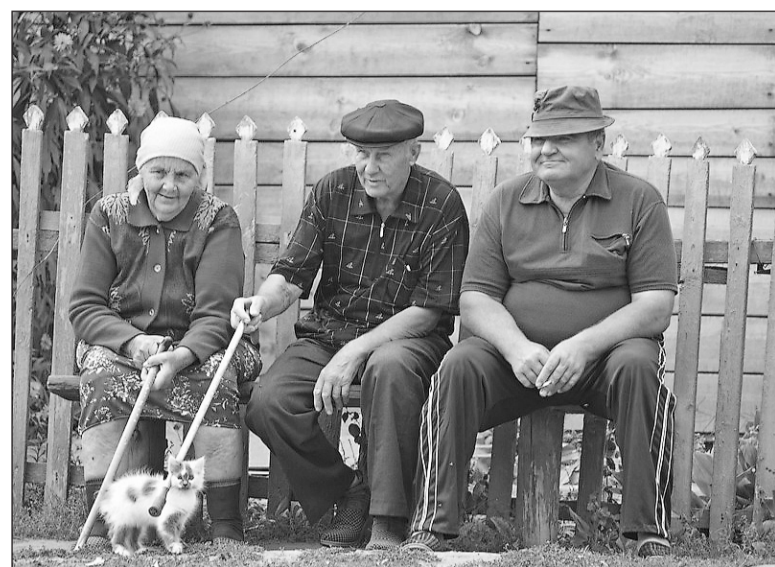
Скоро появится новое звание для ветеранов.

Размер ежемесячной денежной выплаты может составить 600 рублей. Для присвоения звания должны быть соблюдены два условия: трудовой стаж 35 лет