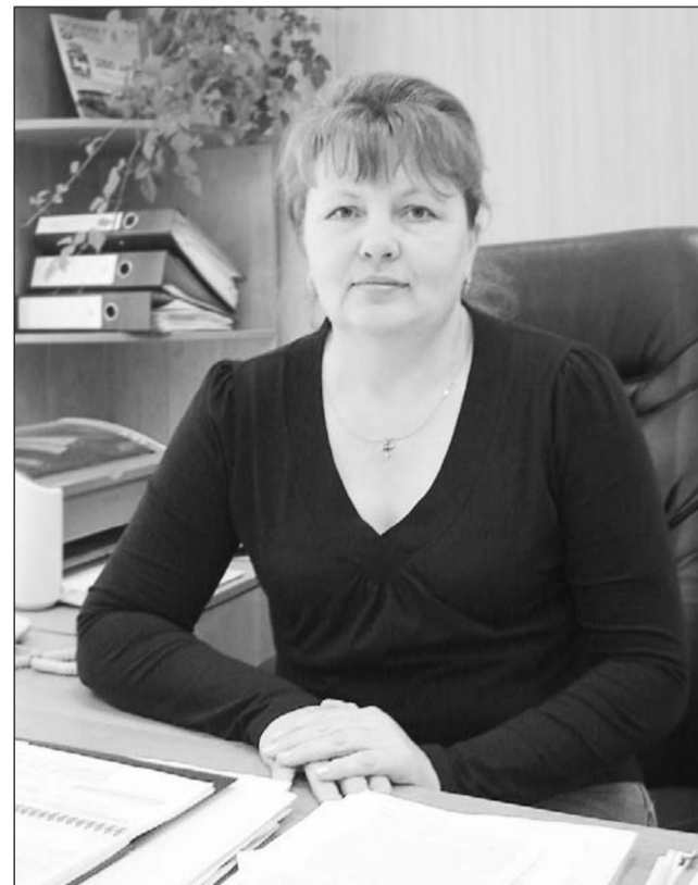
На учебный процесс может влиять управляющий совет школы.

– Одним из показателей того, что летняя оздоровительная кампания прошла успешно, является отсутствие на территории дорожно-транспортных происшествий с участием детей и серьёзных случаев детского травматизма. Из 1544 учащихся школ 1362 отдохнули в лагерях города, Свердловской области и за её пределами, про-