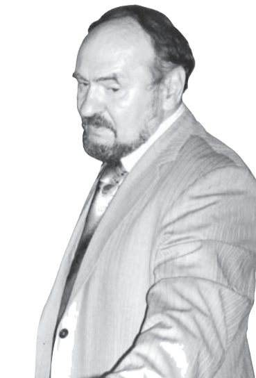
- Людям нужны праздники.