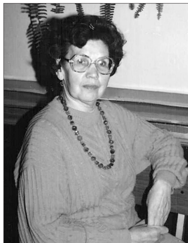
Неутомимый энтузиаст и краевед.