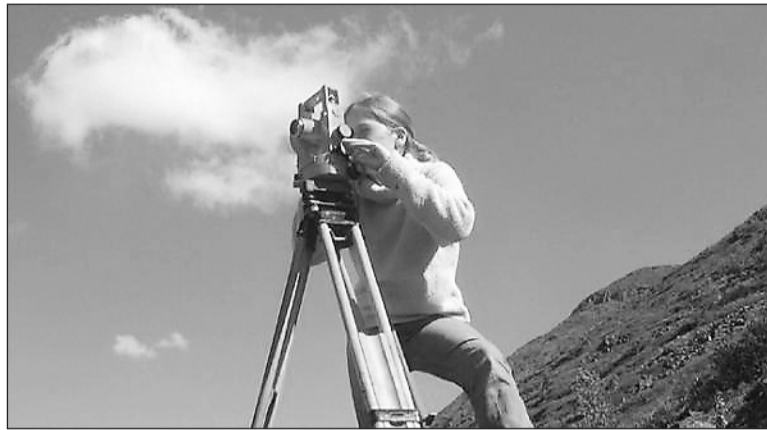
Услуги кадастровой палаты бесплатны.

Государственный кадастровый учёт и предоставление сведений государственного кадастра недвижимости являются государственными услугами, предоставление которых осуществляется органом кадастрового учёта без какого-либо посреднического содействия. В