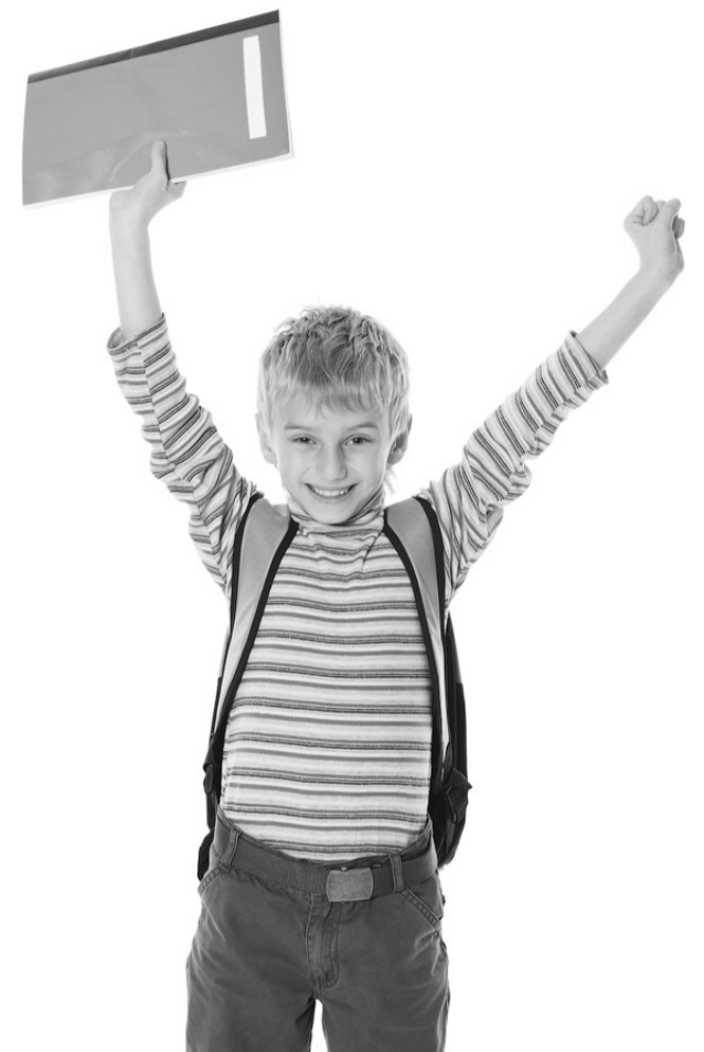
Я уроков не боюсь!