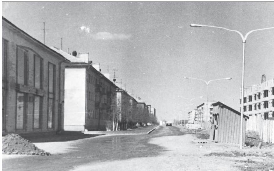
Улица Ломоносова, конец 70-х.

Если в вашем семейном альбоме есть интересные фото молодой застройки Салды или редкие фотографии со старинными зданиями, которых уже нет, приносите их в редакцию. Построим город заново из фото-кирпичиков!