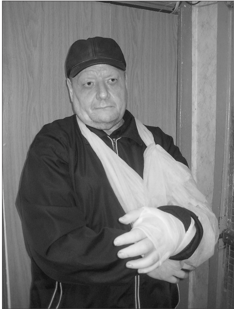
Нападавшие на пенсионера остались безнаказанными.

– Заявление необходимо подавать в любом случае, даже