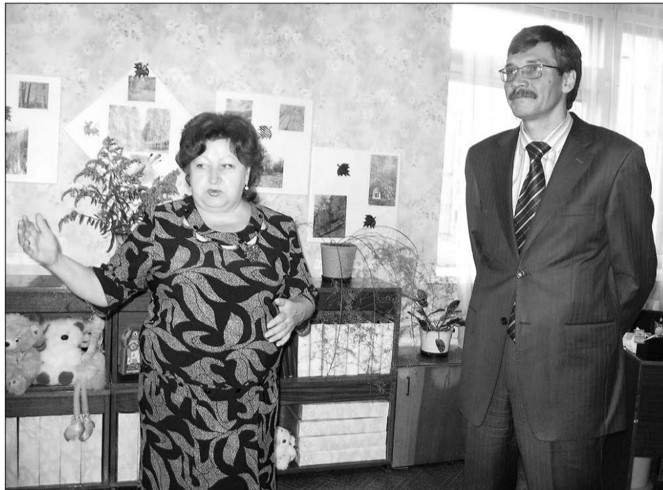
В «Калинке» зам. министра очень понравилось.