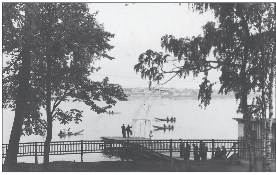
Водная станция, 1954 год.

Если в вашем семейном альбоме есть интересные фото молодой застройки Салды или редкие фотографии со старинными зданиями, которых уже нет, приносите их в редакцию. Построим город заново из фото-кирпичиков!