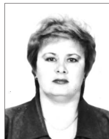
Посмотрите в эти честные глаза...

– По некоторым данным, у неё была масса знакомых во всех инстанциях, в том числе в органах внутренних дел, что позволяло долгое время «не попадаться». Задержание было для неё полной неожиданностью, – продолжает источник в ОВД. – Женщина немедленно была этапирована на отбывание срока. Скорее всего, к нему добавится ещё несколько лет – уже по другим фактам мо-