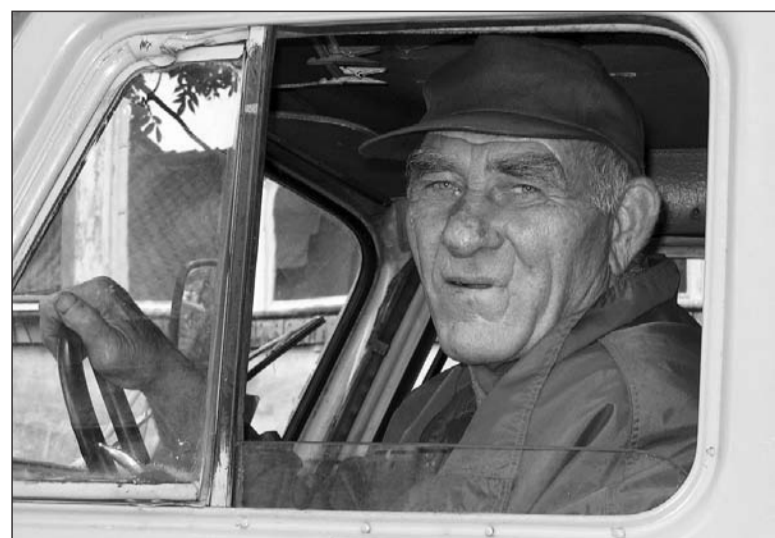
Штраф заплачу, лишь бы дороги ремонтировались.

– Мы обратили внимание, что за 7 месяцев этого года поступления от штрафов в бюджет со-