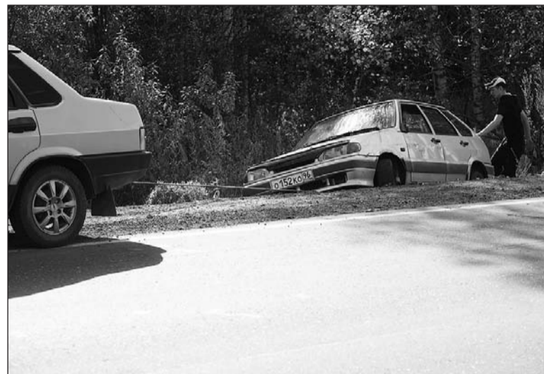
Машины улетели в кювет по разные стороны дорог.