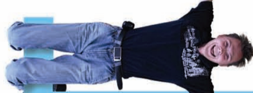
Дмитрий Мерзляков, фотограф