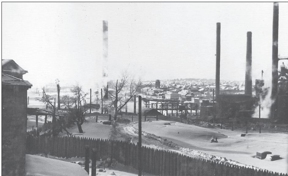
Вид на центральную часть Салды, 1954 год.

Если в вашем семейном альбоме есть интересные фото молодой застройки Салды или редкие фотографии со старинными зданиями, которых уже нет, приносите их в редакцию. Построим город заново из фото-кирпичиков!