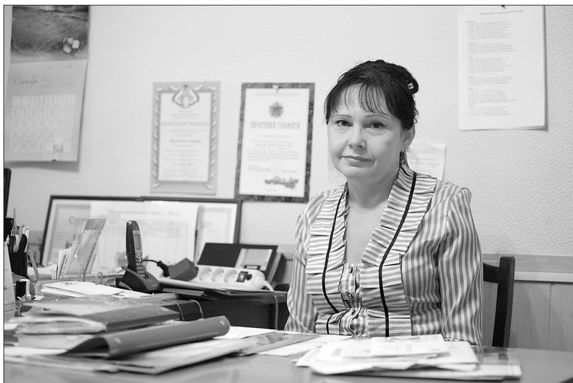
Мы готовы восстанавливать даже родственные связи.

Другое дело, что не каждый нуждающийся пожилой человек может собрать необходимые до-