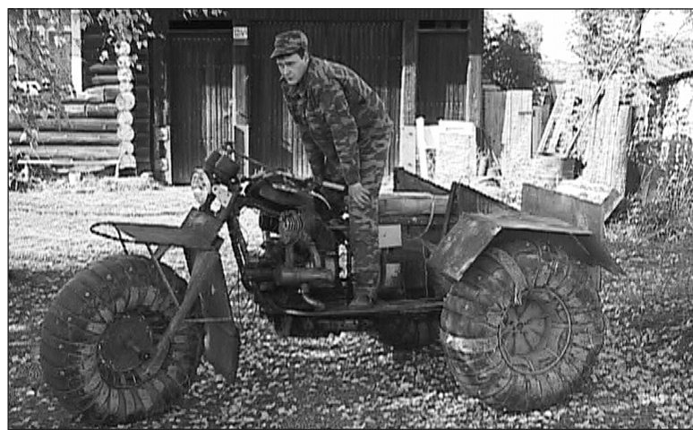
Вездеход - «марабу».

Житель ул. 8 Марта собрал собственный внедорожник для передвижения по лесам и болотам.