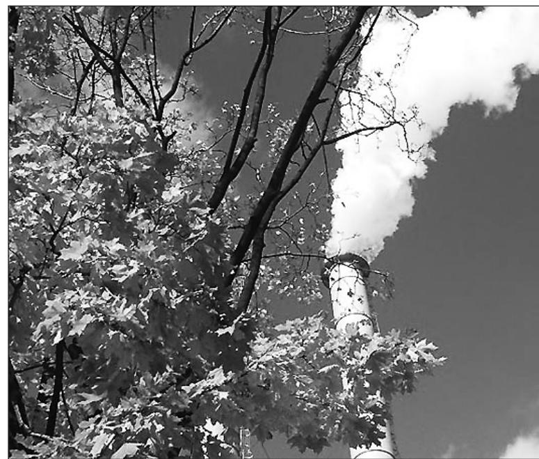
Лучший признак наступившей осени.