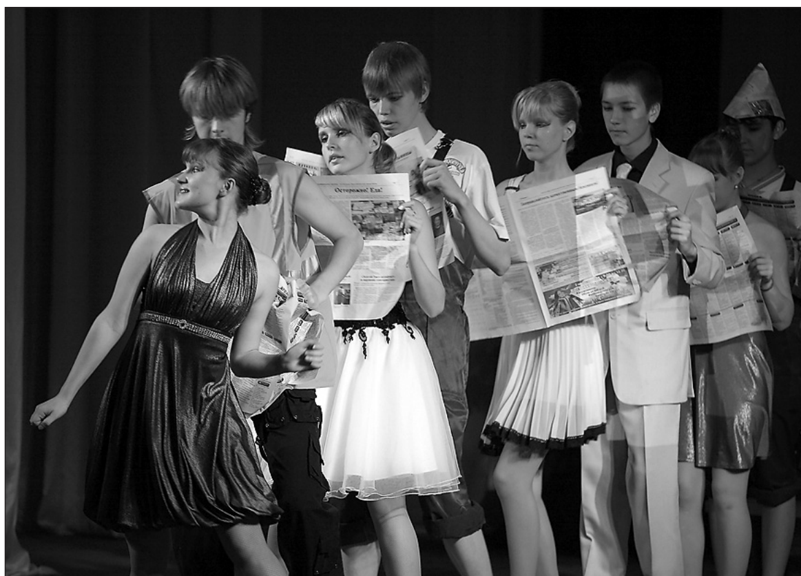
В подарок газете - оригинальный танец.