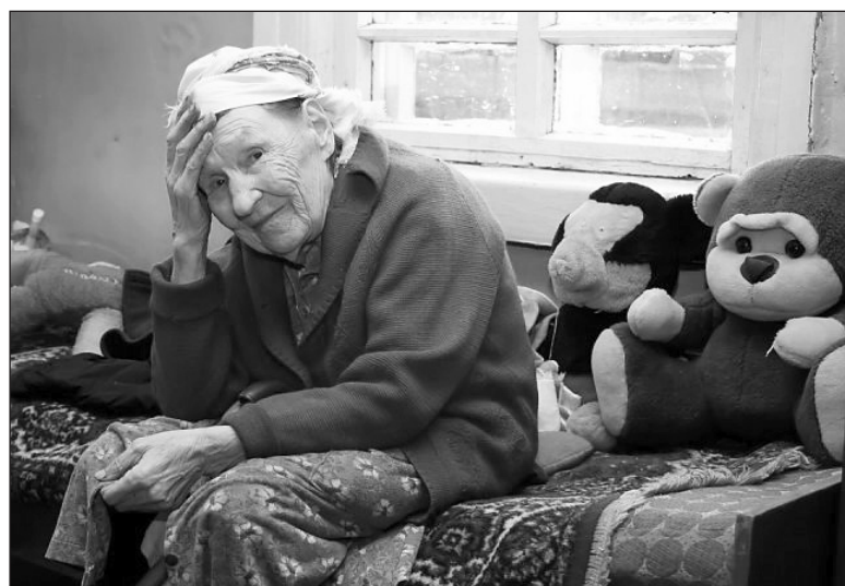
Почитай родителей своих.