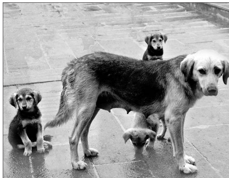
Кто решит их судьбу.

Один раз я сам вытаскивал его с того света. Увидел, что у Тимки на боку огромная 20-сантиметровая рана, на руки его и – к ветеринару. Выходили. А тут после отлова пропал. И сомнений, что его отстрелили, у нас нет! На каком основании это происходит, ведь обещали животных в ошейниках и без признаков агрессии не отлавливать?! Посмотрите телеканал Animal Planet. Там на каждого бездомного пса по ад-