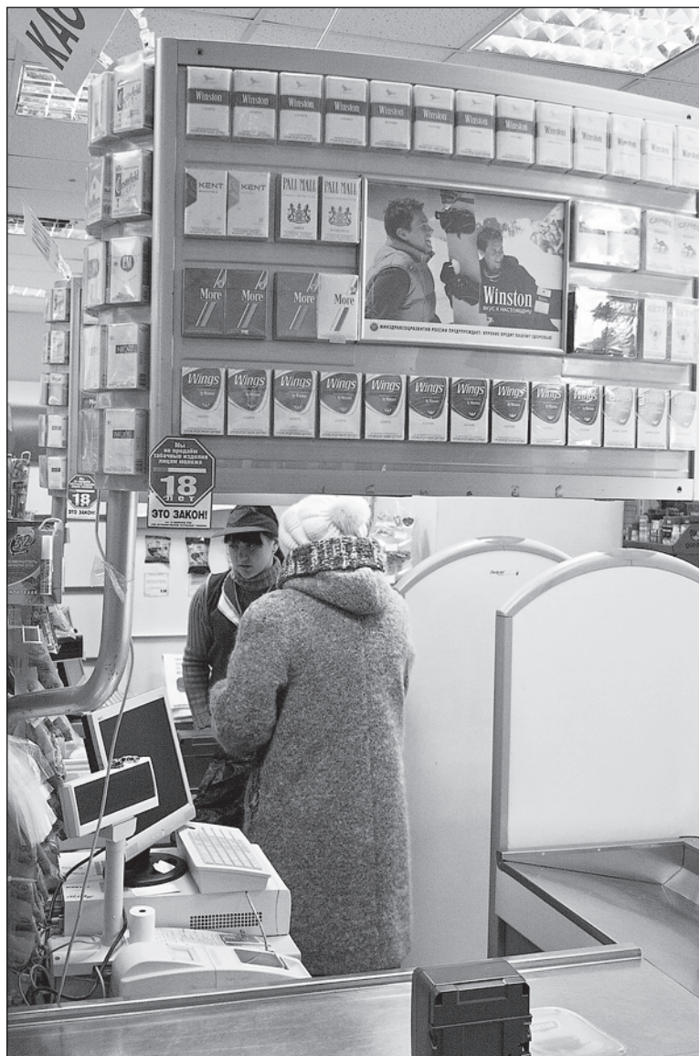
На витрине лишь муляжи.