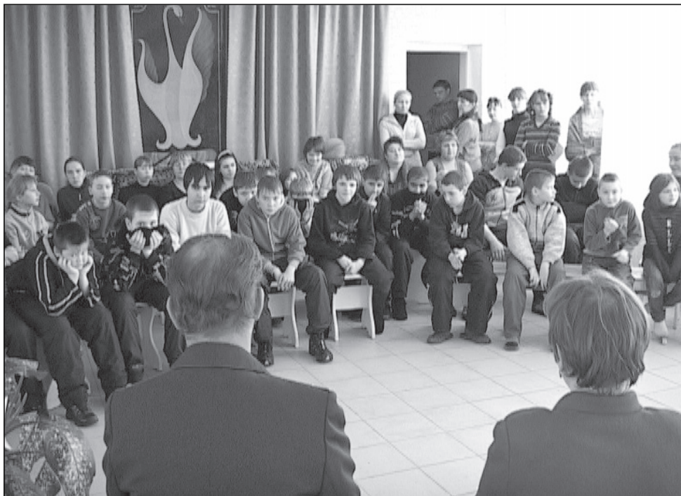
Беседа о том, что такое плохо.

Для школьных атаманов устроили встречу со специалистами органов профилактики.