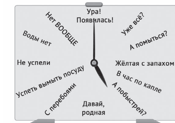
Воды нет, как ни крути.

Это лишь одна из версий. Точное происхождение толчков неизвестно. Информация о том, что источник сотрясений находится на предприятии Химических ёмкостей, также не подтвердилась.