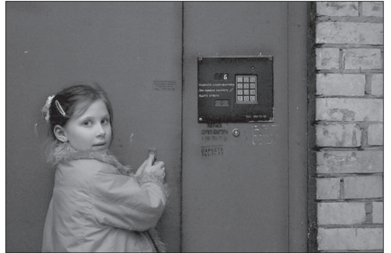
А когда-то двери были всегда открыты.

Имеют ли жильцы подъезда установить домофон, если трое жильцов по материальным соображениям категорически против? Нет ли здесь нарушения их прав? К.