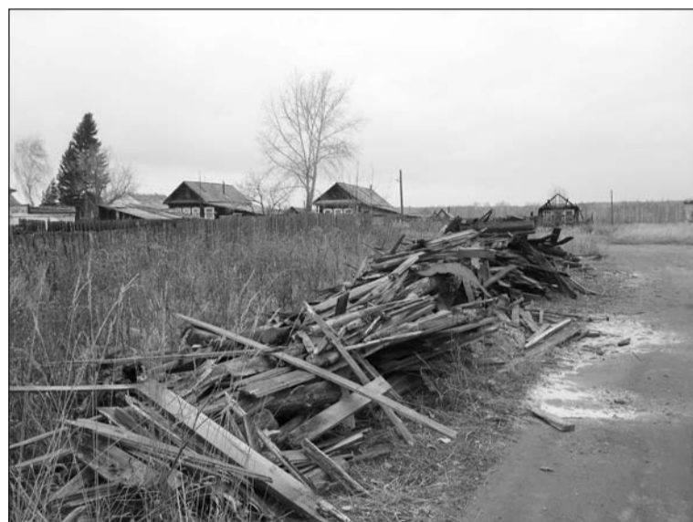
Металлические конструкции пропали сразу, а мусор задержался.

Будут ли убираться горы мусора и хлама после демонтажа водонапорной башни у лесхоза?