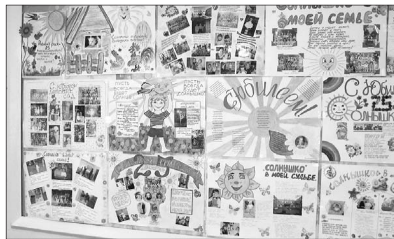
Выставка семейных газет.

Детскому саду № 44 «Солнышко» 28 октября исполнится 25 лет.