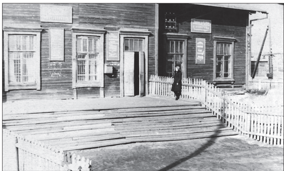
Станция Н. Салда, 1954 год.

Салда не сразу строилась! Проект к 250-летию города! Если в вашем семейном альбоме есть интересные фото молодой застройки Салды или редкие фотографии со старинными зданиями, которых уже нет, приносите их в редакцию. Построим город заново из фото-кирпичиков!