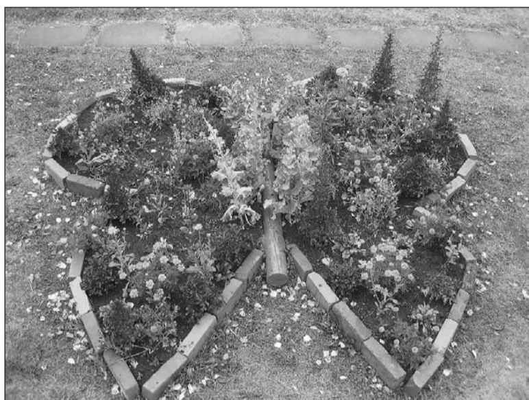
«Бабочка» принесла «Калинке» удачу.

Победителями конкурса «Клумба года» стали воспитанники младшей группы №3 детского сада «Калинка».