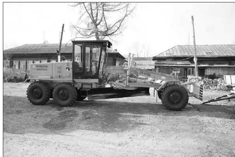
Готовь грейдер осенью.

Вслед грейдеру через неделю в город прибыла вторая ценная покупка – экскаватор. На очереди – фронтальный погрузчик,