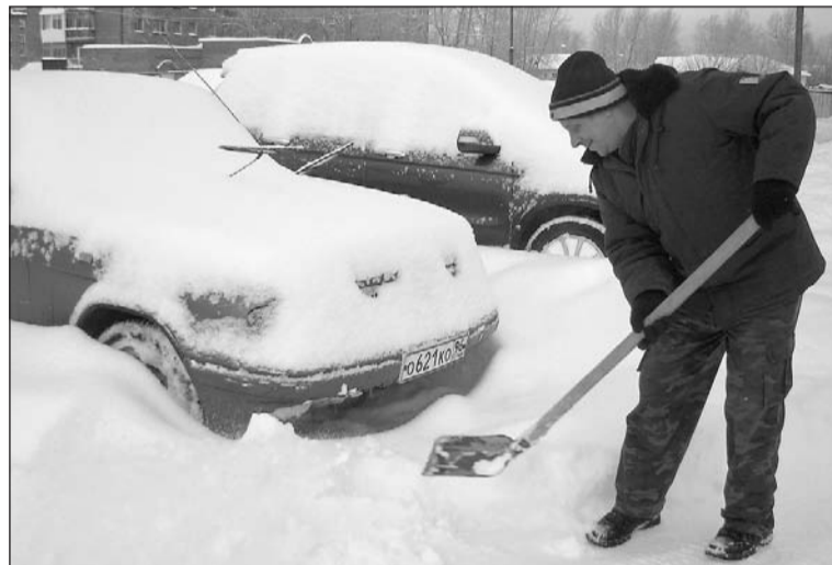
Ещё не откопались.