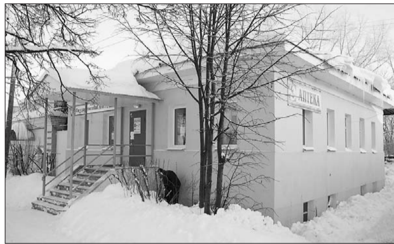
Не прошло и года - аптека закрылась.

Коллективные просьбы от населения оставить аптеку поступают ежедневно. Власти хотят успокоить горожан – они намерены до конца отстаивать интересы салдинцев и сохранить эту аптеку, отправив письменные обращения в министерства