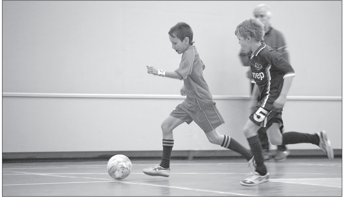
Салдинцы на шаг впереди соперника.