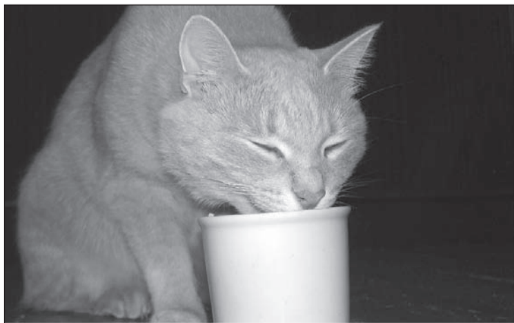
Кот Тимоша - любитель кефира.