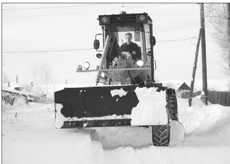
Грейдера Сердюков работает по 18 часов в сутки.

Стоит заметить, что тротуары у жилых домов должны чистить дворники управляющих компаний, а вот внутридворовые дороги считаются территорией городской, а значит и снегоуборочная техника должна