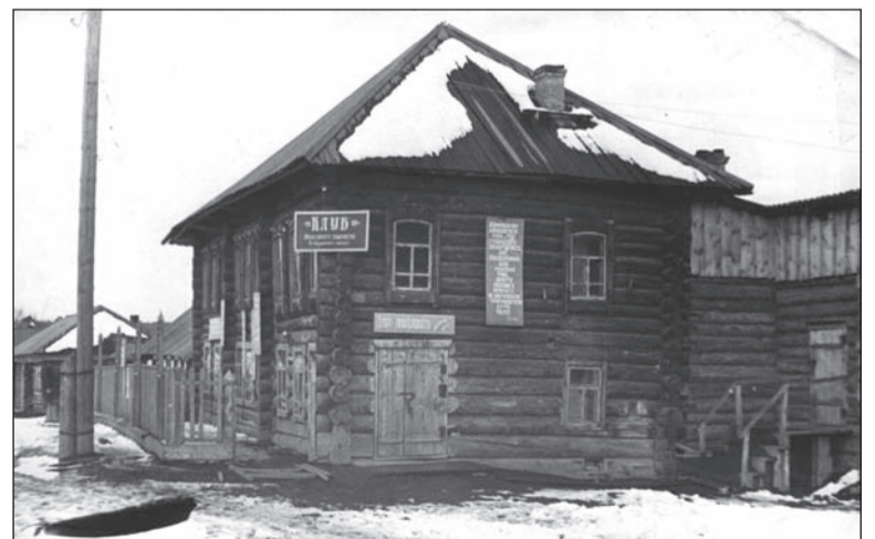
Правление колхоза «Красный пахарь», 50-е годы, с. Медведево.

Если в вашем семейном альбоме есть интересные фото молодой застройки Салды или редкие фотографии со старинными зданиями, которых уже нет, приносите их в редакцию. Построим город заново из фото-кирпичиков!