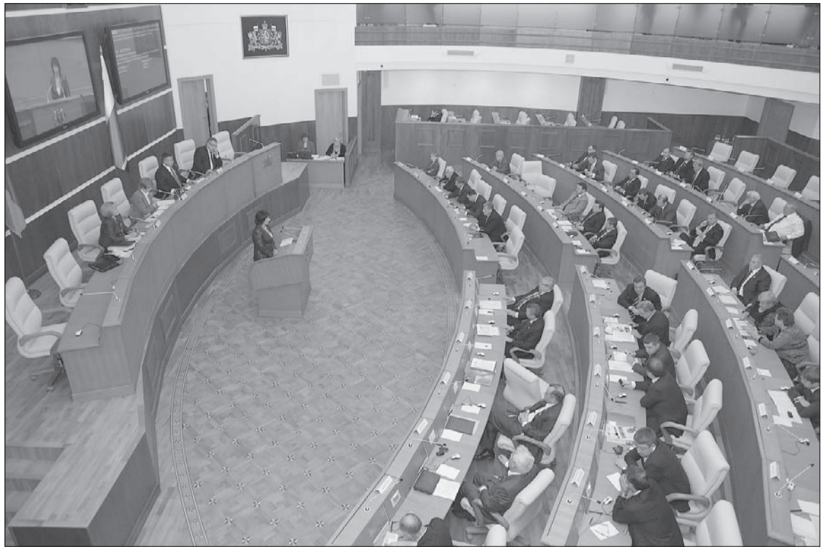
Депутаты обновили Устав области.

В частности, выступающими отмечалось, что необходимость принятия новой редакции Устава назрела, она продиктована временем. Действующий в настоящее время Устав принимался в конце минувшего века, в