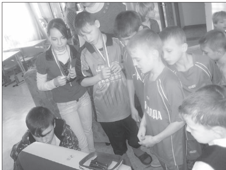
Новую технику уже опробовали.

Воспитанники Детского дома одержали сразу две победы в областном турнире по мини-футболу в Нижнем Тагиле и увезли с собой все призы.