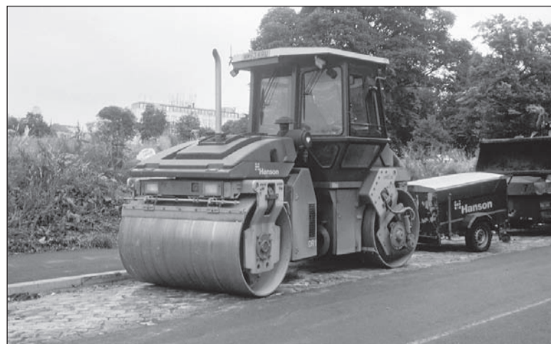
Будет и на вашей улице каток.

Предусматриваются средства в бюджете на благоустройства территории между Строителей, 1