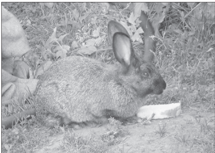
Кролик – любитель белого батона.