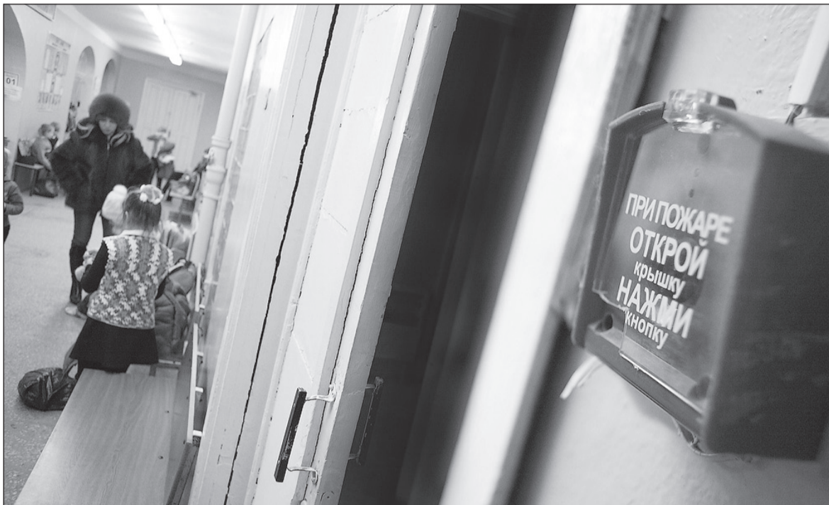
Учения подготовили всех к реальной опасности.

В гимназии прошли пожарные учения, о которых заранее никто не знал.