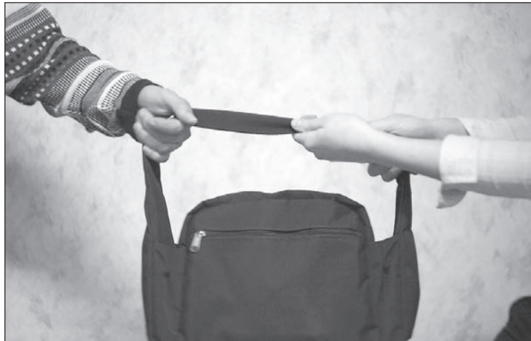
Сумку с документами не уберегла.

Добычей грабителя стали только многочисленные документы, которые женщина постоянно носила с собой.