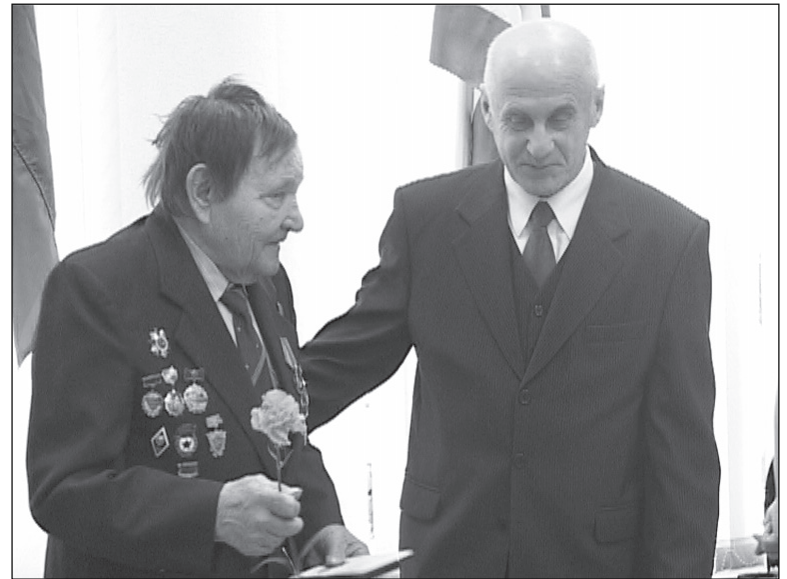
Чествовать ветеранов будут всю весну.