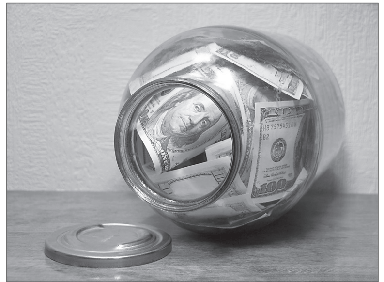
Деньги лучше хранить в банке

– Согласно внутреннего нормативного документа Сбербанка России, регламентирующего порядок работы с компенсацией по вкладам, компенсация по принятым заявлениям должна быть зачислена в 30-дневный срок с момента подачи заявления. В случае, если компенсация будет зачислена раньше указанного срока и клиент при подаче заявления оставит контактный телефон, то сотрудники банка информируют клиента о возможности получения компенсации.