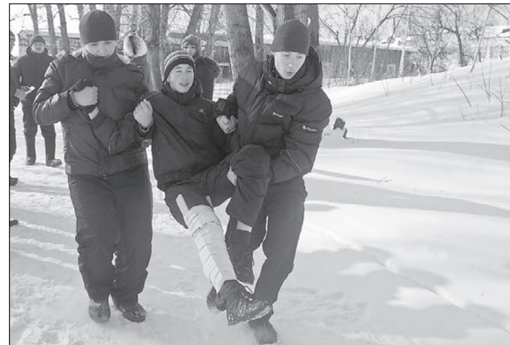
До финиша «дожили» все.

26 февраля там проходила военизированная игра «Зарница», в которой приняли участие школьники города и студенты профучилища.