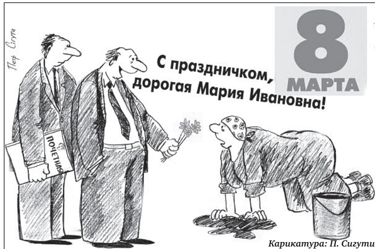
Подъезд убирают женщины-добровольцы.

Скажите, что входит в пункт «Содержание жилья». По закону в платёж уже должна входить уборка и управленческие расходы. В декабре 2009 платила 2,46 руб., в январе 2010 уже 3,15 руб. на человека, а нас проживает 3 человека. Пользователи компании «Жилой Дом».