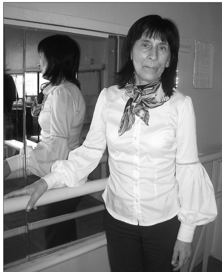
40 лет у танцевального станка.