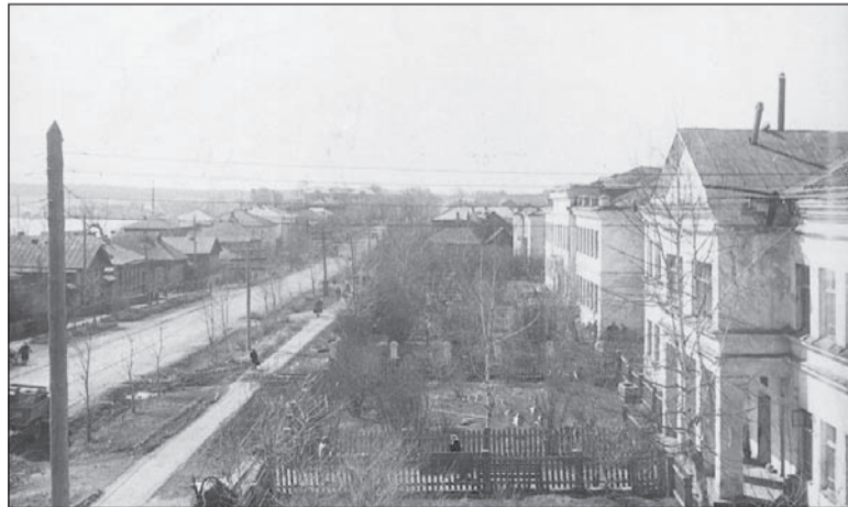
Вид на улицу К. Маркса, 60-е годы.

Наш адрес: ул. Ломоносова, 11, e-mail: gorodns@mail.ru