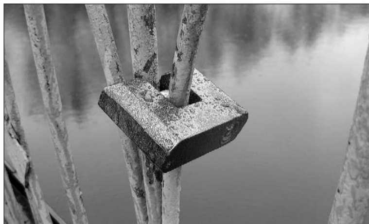
Единственный уцелевший замок.