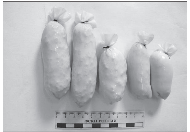
Чтобы наркотики не вышли раньше срока, курьер сидел на жёсткой диете.

Телефон доверия Госнарконтроля: (3435) 25-69-31.