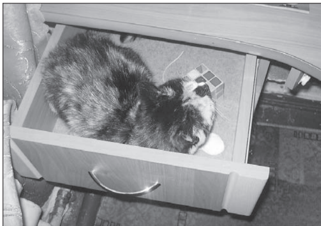
Кошка Лиза любит головоломки.