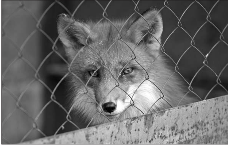
Ещё щенком лиса покинула леса.

Пока Феликс перебивается на случайном прикорме, плутовка вольготно живёт в вольере возле магазинного склада. Рыжая ещё не полиняла и выглядит как с обложки. К тому же у неё замечательные условия – свежий воз-