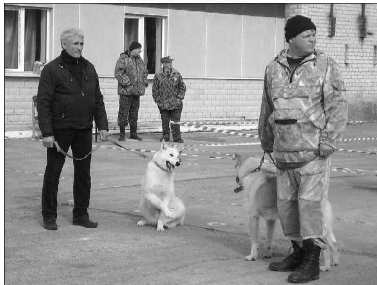
Человек собаке друг.

Нижняя Салда приняла 40-ю районную выставку охотничьих собак. По конкурсному рингу прошли всего 18 питомцев.