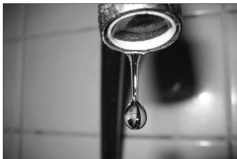
Последняя капля терпения людей.

– Минувшей зимой вопрос о том, что Тепловодоканал не справляется с поставленными