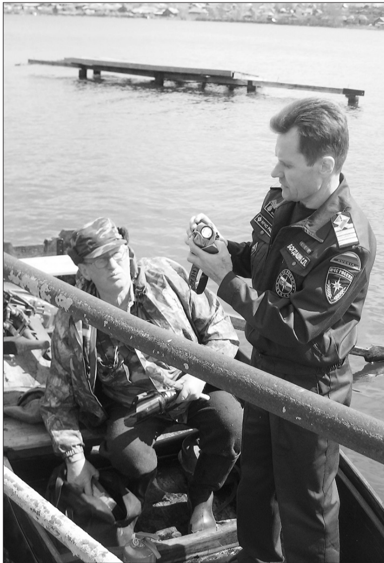
Техосмотр пройден, счастливо плаванья!