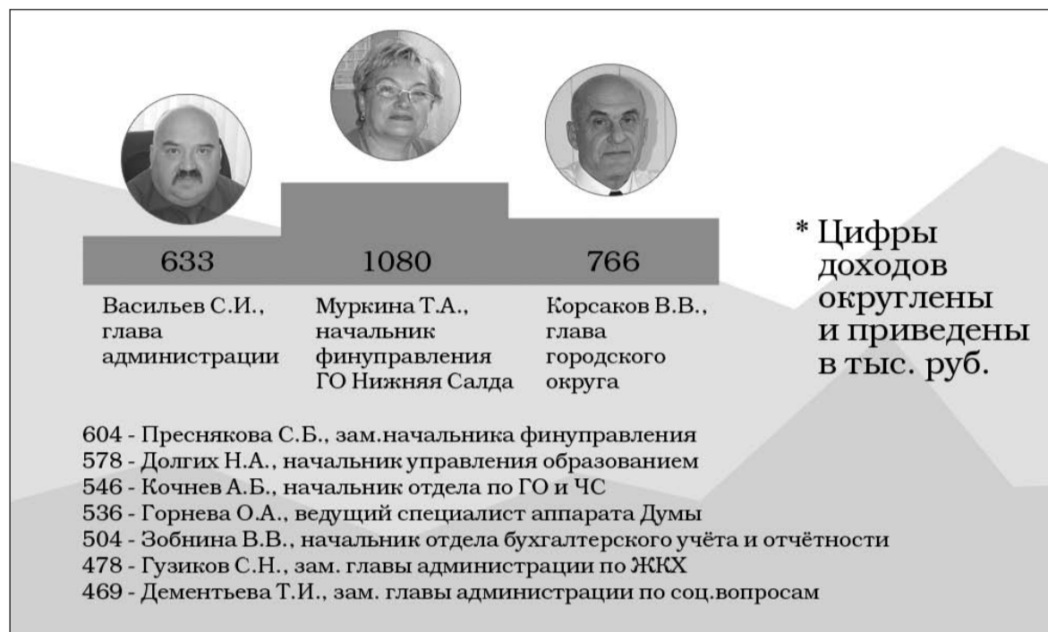
Сводные данные деклараций.

Это, как известно, не очень хорошо, но интересно. И так, кто из наших чиновников и сколько заработал за 2010 год?