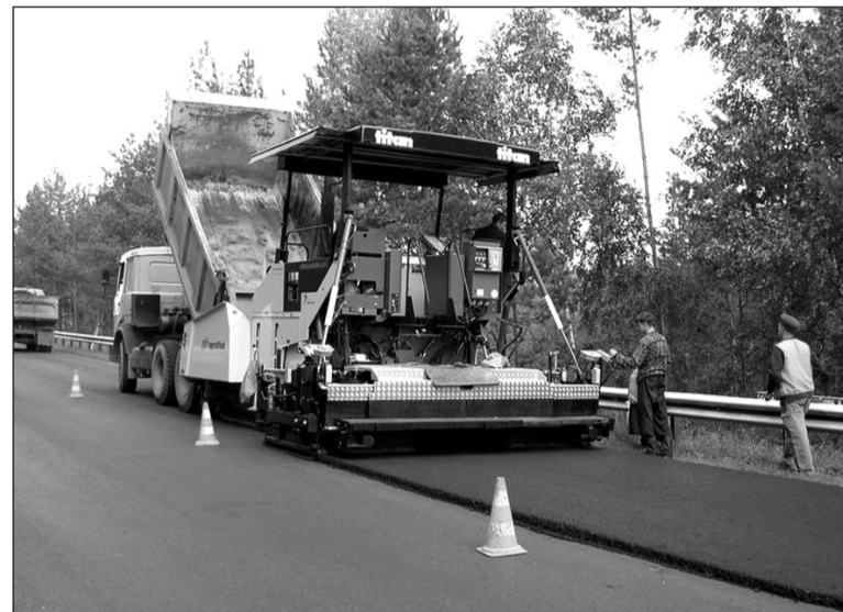
Такой размах строительства давно ждёт Чепак-штрассе.

являются не только новые автомобильные дороги, но и высокоскоростные железные. Так, к 2013 году планируется сократить время движения поездов между Екатеринбургом и Нижним Тагилом с 2,5 часов до 1 часа 40 минут. Высокоскоростная магистраль должна также соединить Урал с Москвой к Чемпионату мира по футболу в 2018 году. Рассматривается проект реконструкции железной дороги и до