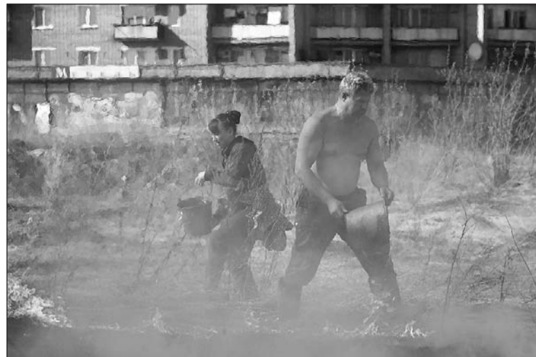
Спасём наш островок!

На въездах в населённые пункты организована минеральная