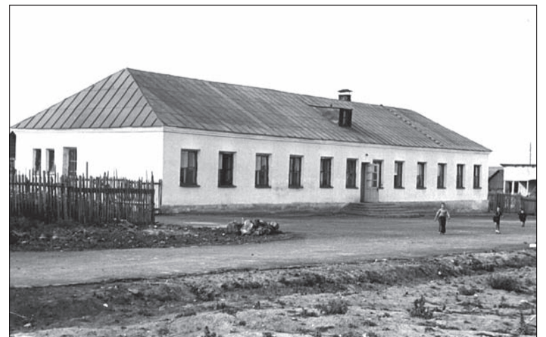
Детсад №8, 1960 год.

Если в вашем семейном альбоме есть интересные фото молодой застройки Салды или редкие фотографии со старинными зданиями, которых уже нет, приносите их в редакцию. Построим город заново из фото-кирпичиков!