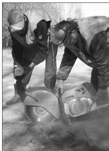
Режет как по маслу.

Первые ямы залатали в начале мая – по маршруту парадного шествия. Только на них ушло порядка 10 тонн асфальта. Впереди у коммунальчиков всё лето и ямочный ремонт на Фрунзе до остановки «ул. Победы», а также по всем автобусным маршрутам – улицы Ленина, К. Маркса, П. Коммуны и Р. Молодёжи. Заплаты – временное решение про-