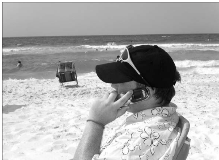
Мама, я вижу море

Недавно подключился к оператору сотовой связи МОТИВ. Очень удобно и выгодно звонить по области, но летом я собираюсь съездить за границу. Мне придётся менять сим-карту или можно продолжать экономить с Мотивом?