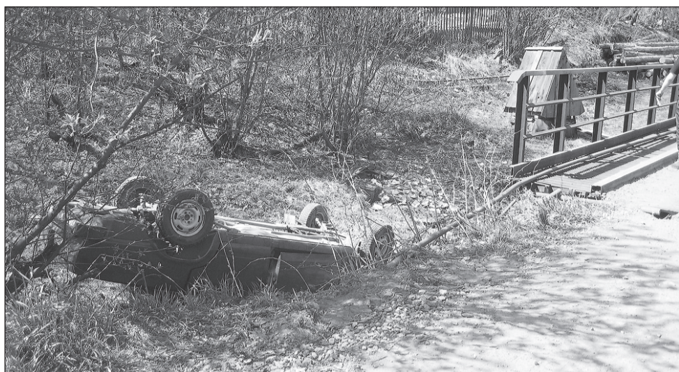
За вождение далеко не «пятёрка».

19-летняя девушка села за руль, не имея прав и в алкогольном опьянении.