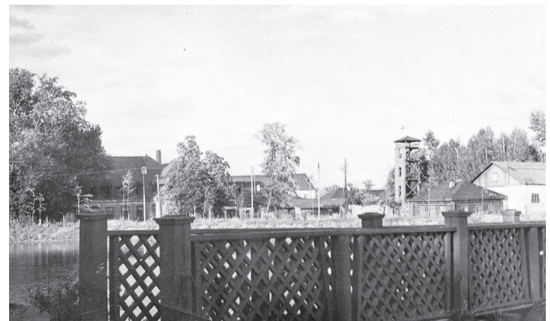
Деревянный мостик, вид на дом управляющего. 50-е годы.

Если в вашем семейном альбоме есть интересные фото молодой застройки Салды или редкие фотографии со старинными зданиями, которых уже нет, принесите их в редакцию. Построим город заново из фото-кирпичиков!