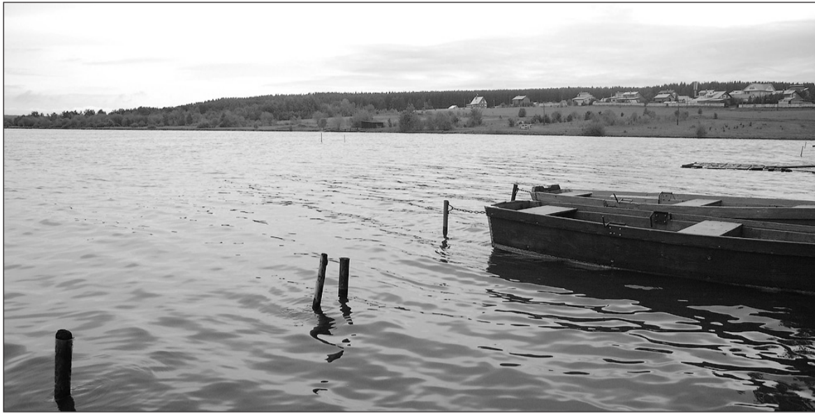
Операция спасения проходила на глазах жителей района Медянки.

Спасателя планируют представить к государственной награде за спасение утопавших в районе Медянки.