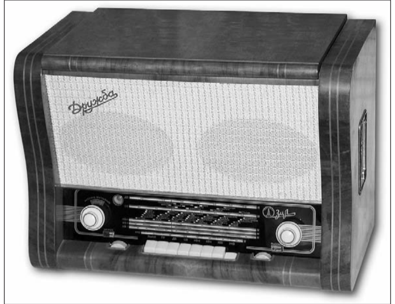
Ради радио в Салде...

Читатели уже не в первый раз присылают sms-вопросы на тему радиоволн в Салде. Корреспонденты «Вестника» с такой же частотой искали на них ответ. Факт остаётся фактом – FM-радио в Нижней Салде официально нет. Для вещания заявленных читателем радиостанций нет лицензии и технических условий.