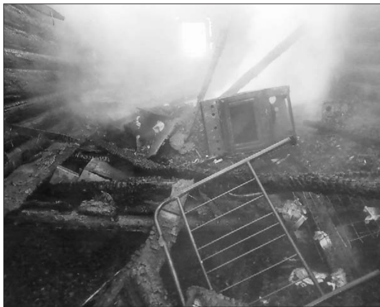
Остатки былой роскоши.

Дом сгорел полностью. Площадь пожара составила 200 квадратных метров. Сегодня устанавливается ущерб и причина возгорания.