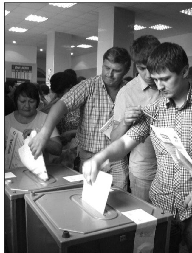
Кандидатов в депутаты Госдумы от «ЕДИНОЙ РОССИИ» выбрали свердловчане.

В лидерах народного голосования в Свердловской области