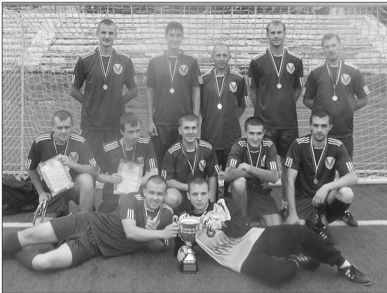
В принципиальной борьбе снова первые.

Команда НИИМаш выиграла в открытом первенстве Верхней Салды на призы ФСК «ВСМПО-Старт».