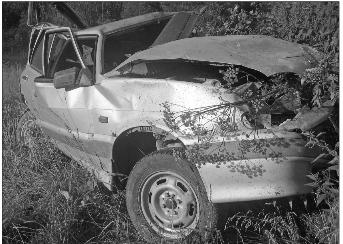
Нет живого места.