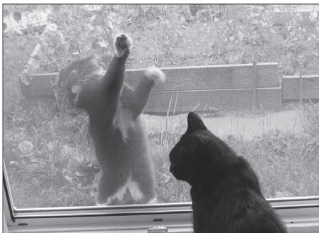
- Выходи скорей гулять, дорогая!

Фотоконкурс, посвященный символам года – Коту и Кролику.