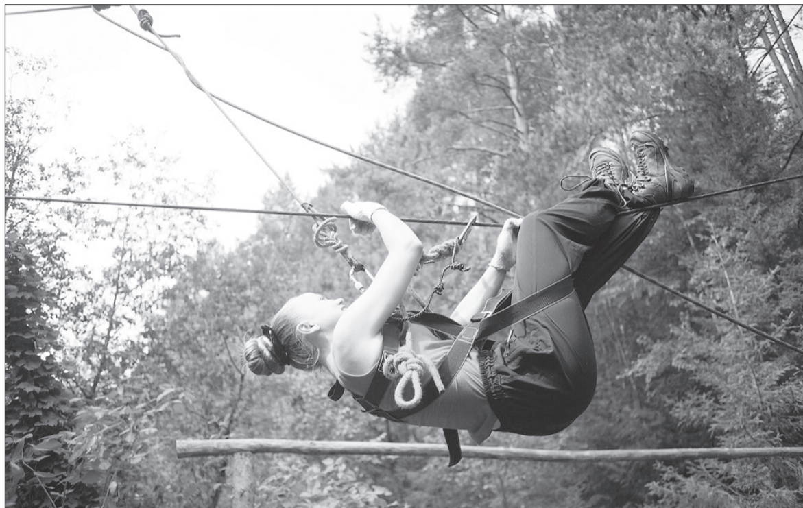
Здесь вам не равнина ...

6 августа прошёл очередной туристический слёт НИИМаш. В этом году на участие в соревнованиях было заявлено 18 команд, каждая из которых показала себя достойно.