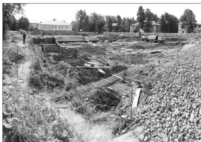
Через год на этом месте появится 2-этажный детсад.

- Строительство детского сада идёт при поддержке партии «Единая Россия». Всего на строительство из областного бюджета в 2011 году выделено 36 млн. рублей, 4 млн. запланировано в