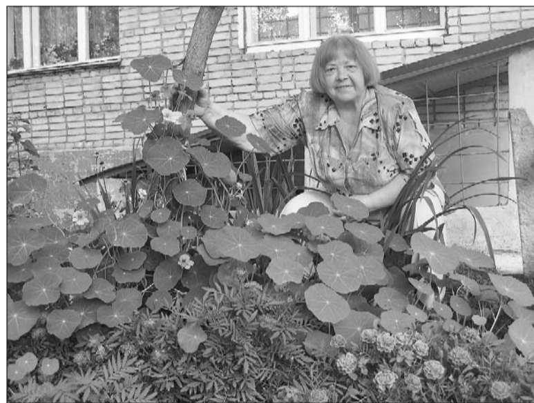
Райский сад под окном.

Солнечные клумбы между пятым и шестым подъездами дома №15 ул. Ломоносова не первый год привлекают внимание прохожих.