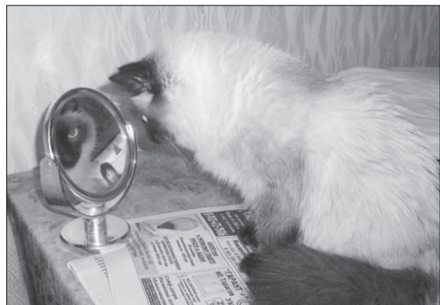
- Свет мой, зеркальце, скажи.

Фотоконкурс, посвящённый символам года – Коту и Кролику.