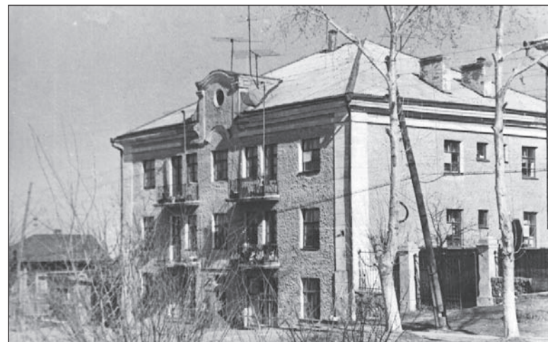
Магазин №21 по ул. К. Маркса, 70-е годы

Если в вашем семейном альбоме есть интересные фото молодой застройки Салды или редкие фотографии со старинными зданиями, которых уже нет, приносите их в редакцию. Построим город заново из фото-кирпичиков!