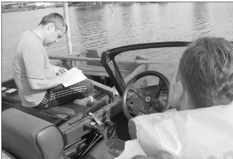
Рыбак отделался малым штрафом.

12 августа в акватории Нижнесалдинского пруда прошёл рейд по маломерным судам. За три часа старший инспектор ГИМС выявил троих нарушителей и выписал им внушительные штрафы.