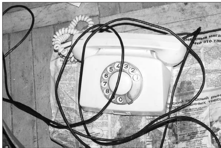
Оплатить квитанцию по телефону, к сожалению, нельзя.

Почему не носят квитанции за стационарный телефон по ул. К. Либкнехта, 135. Мы согласны платить, если квитанции будут доставлять вовремя. У нас периодически всплывают задолженности по оплате.