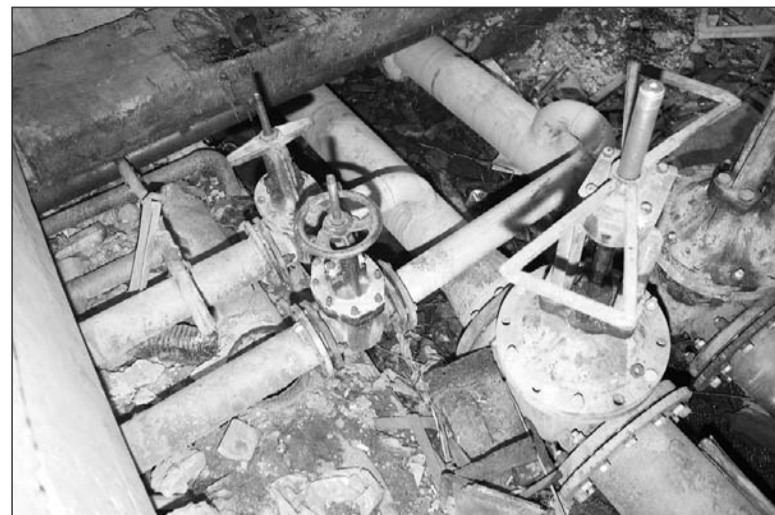
Жизненно важная система дома.

– Основным достижением является то, что подпитка котлов на котельной НТМК-НСМЗ сократилась с 45 м3/ч до 2 м3/ч,