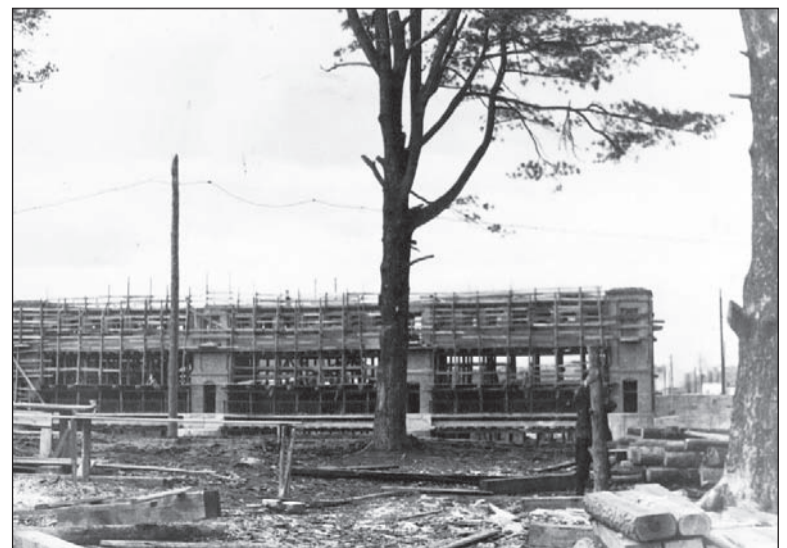
Головное сооружение плотины в лесах, 1953 г.

Если в вашем семейном альбоме есть интересные фото молодой застройки Салды или редкие фотографии со старинными зданиями, которых уже нет, приносите их в редакцию. Построим город заново из фото-кирпичиков!