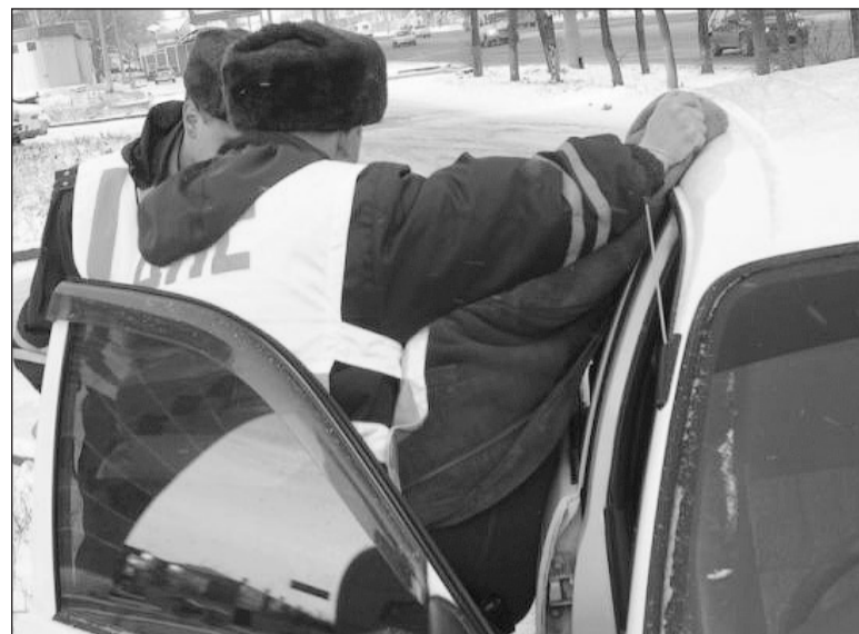
Оскорбление полицейских карается рублём.