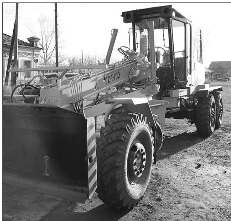
Появления спецтехники ждут на каждой улице.

Нельзя ли включить в план на следующий год грейдеровку ул. Д.Бедного (квартал между ул. Крупской и ул. 1 Мая)?