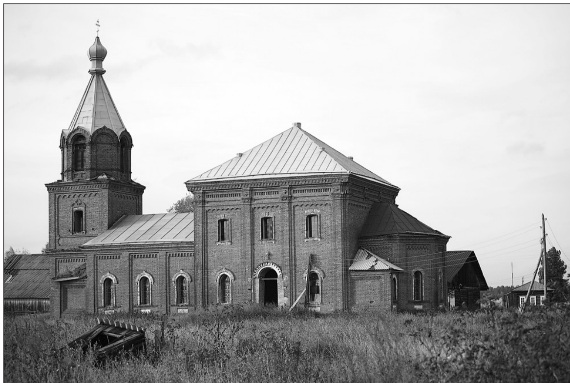
Поможем Храму Успения Пресвятой Богородицы.

– Служба была очень сильная. Владыка нам понравился, надеюсь, что это не последний его визит в Салду, – сказала прихо-