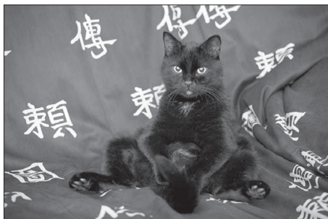
Кот Марс всегда умеет найти баланс.

Фотоконкурс, посвящённый символам года – Коту и Кролику.