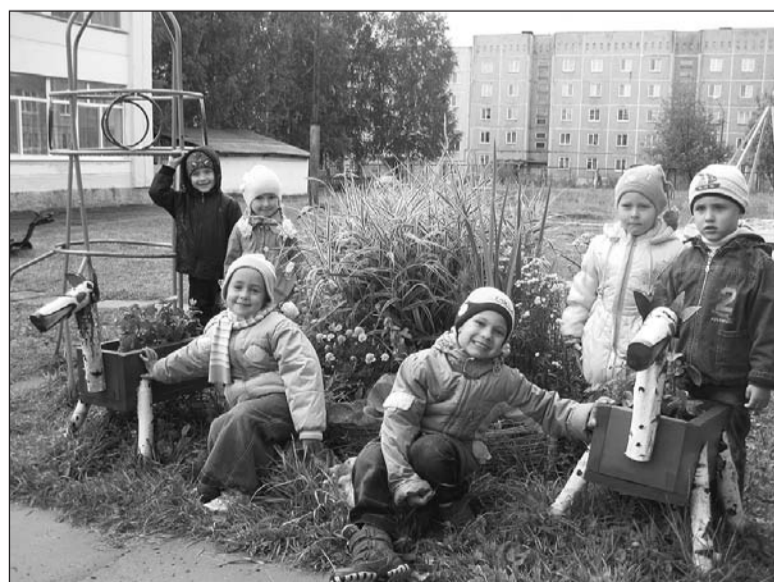
Уроки ландшафтного дизайна в детсаду.

Участие детсада «Калинка» в конкурсе «Клумба года» стало доброй традицией. В прошлом году идея оформить клумбу в виде бабочки была признана лучшей.