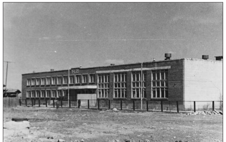
Свежепостроенная «семёрка», начало 70-х.

Если в вашем семейном альбоме есть интересные фото молодой застройки Салды или редкие фотографии со старинными зданиями, которых уже нет, приносите их в редакцию. Построим город заново из фото-кирпичиков!