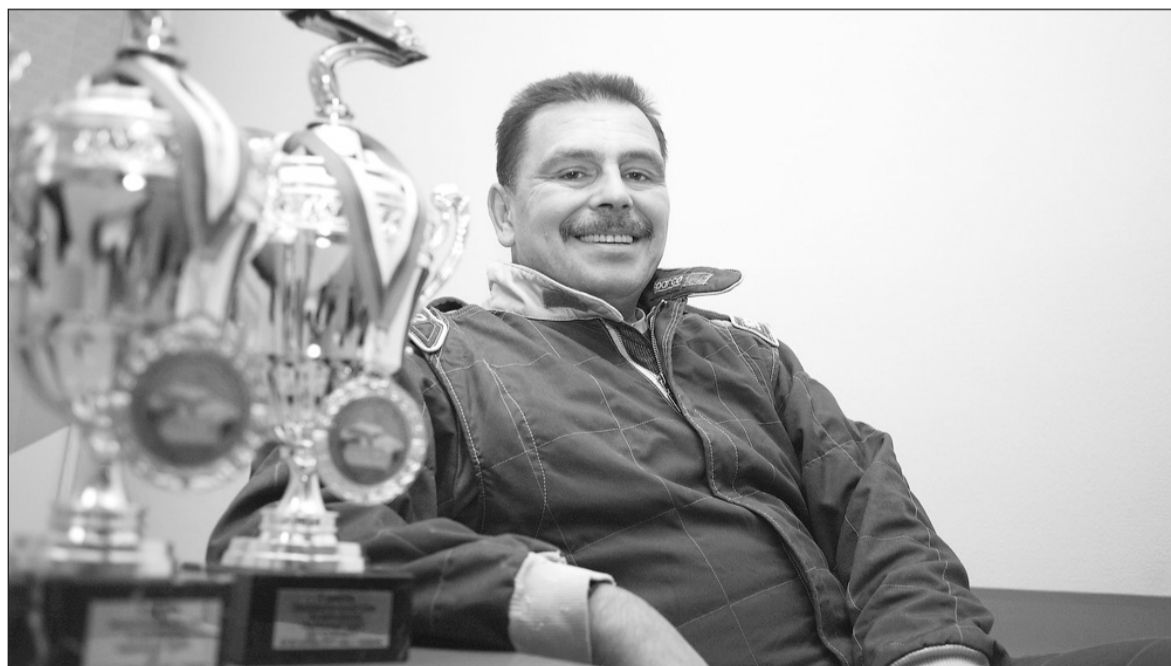
Пилот доволен своими успехами.