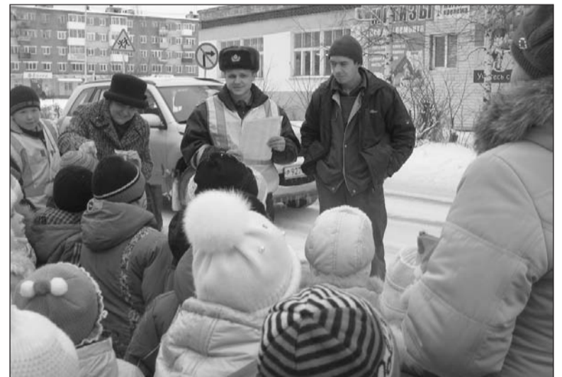
Дошколята стали свидетелями нарушений ПДД.

Участники отряда юных инспекторов дорожного движения из школы № 10 и воспитанники детского сада «Солнышко» приняли участие в акции «Письмо водителю».