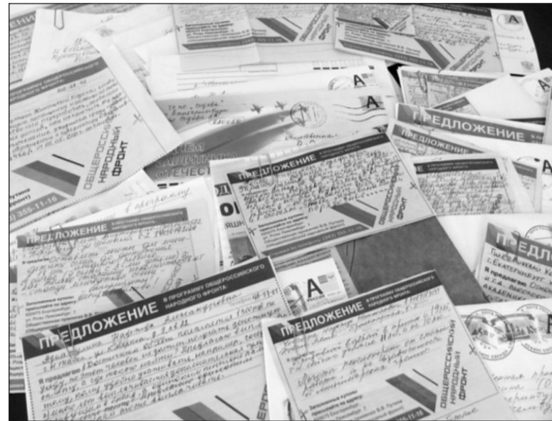
Тысячи уральцев прислали свои предложения в Народную программу