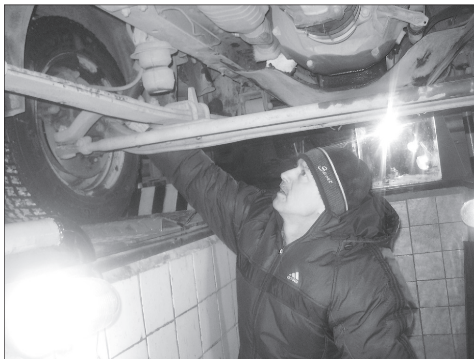
Диагностика авто обойдётся в 300 руб.

Пункт технического осмотра «Салда-Авто» возобновляет свою работу с 1 декабря.