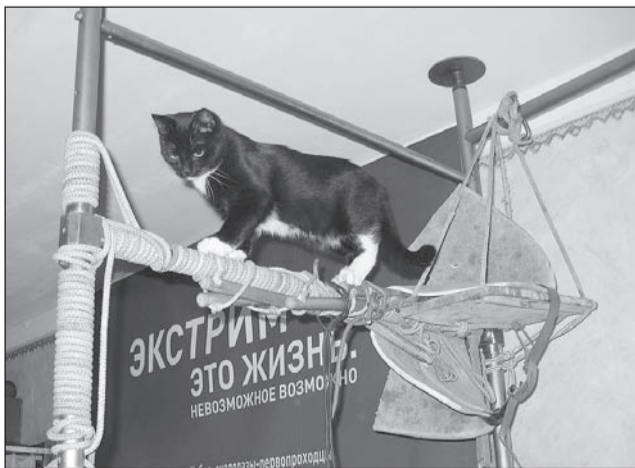
Вверх за адrenaлином.