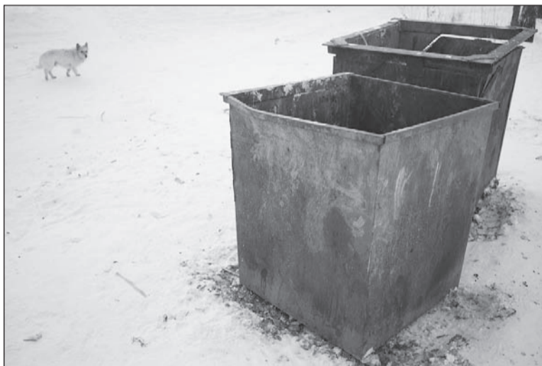
Мусор меряют квадратными метрами.