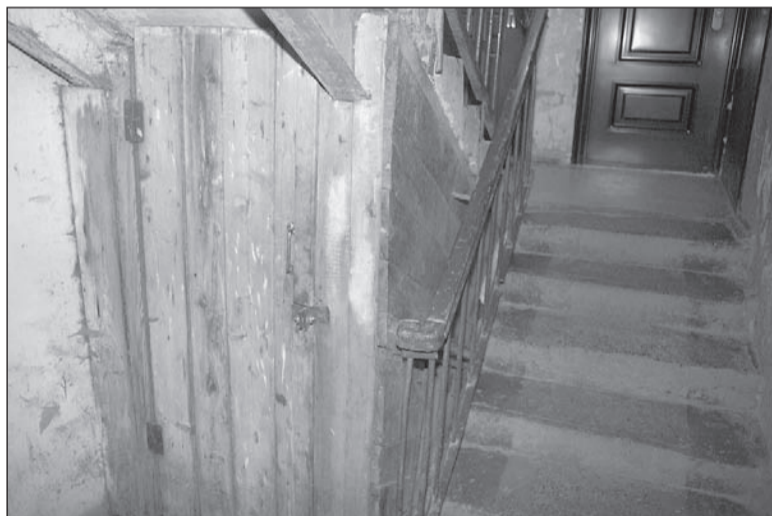
Резкий запах витает в воздухе.

В доме 57 по ул. Строителей (1 подъезд) недавно из-за остановки коллектора фекальные стоки попали в подвал, УК аварию устранила, но ужасный запах так и остался.