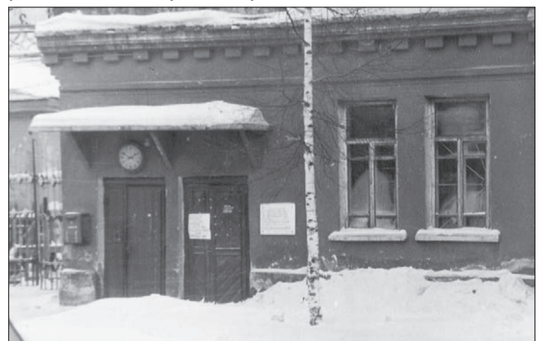
Проходная мезавода, 1971 г.

Если в вашем семейном альбоме есть интересные фото молодой застройки Салды или редкие фотографии со старинными зданиями, которых уже нет, приносите их в редакцию. Построим город заново из фото-кирпичиков!