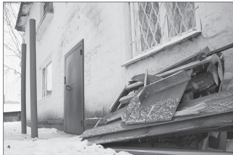
Бескозырка на подъезде.