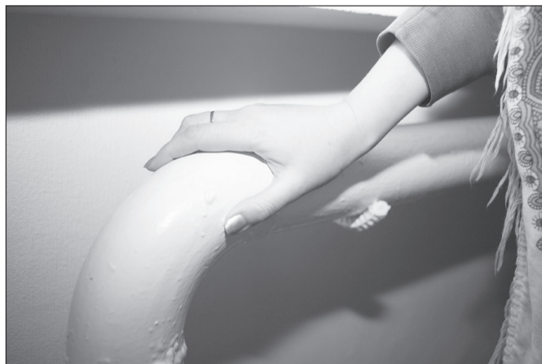
Заранее платим за потерянное тепло.