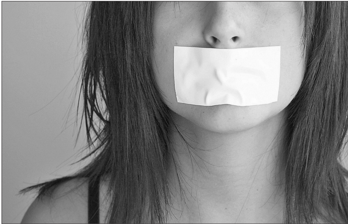
Несколько часов в неволе показали вечность.

Бывший друг связал девушку скотчем и насильно удерживал в квартире.