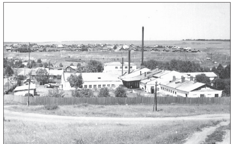
Корпуса хлебозавода, 1978 г.

Если в вашем семейном альбоме есть интересные фото молодой застройки Салды или редкие фотографии со старинными зданиями, которых уже нет, приносите их в редакцию. Построим город заново из фото-кирпичиков!