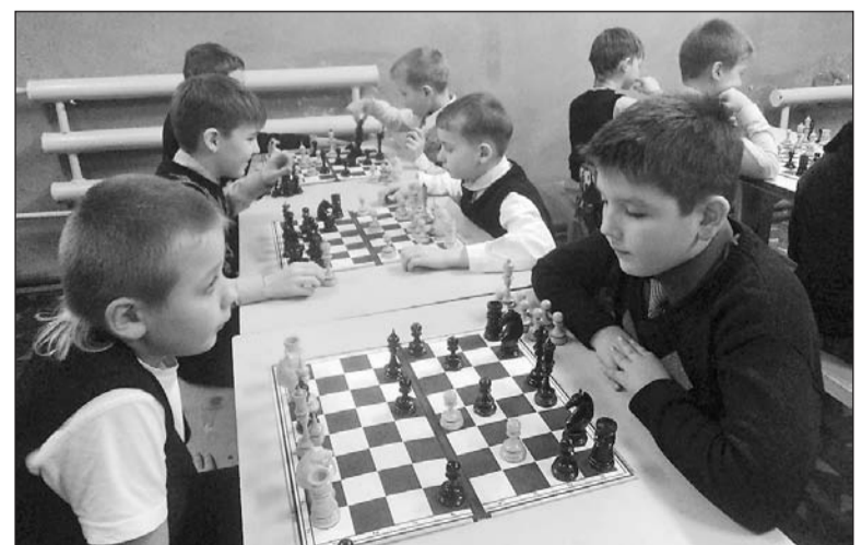
Думать на несколько ходов вперёд.

Часы работы проката: Ср Чт Пт – с 15.00 до 21.00 без перерыва Сб Вс – с 12.00 до 22.00 (перерыв с 16.00 до 17.00) Стоимость 1 часа – 30 рублей. Приходите, будет жарко!