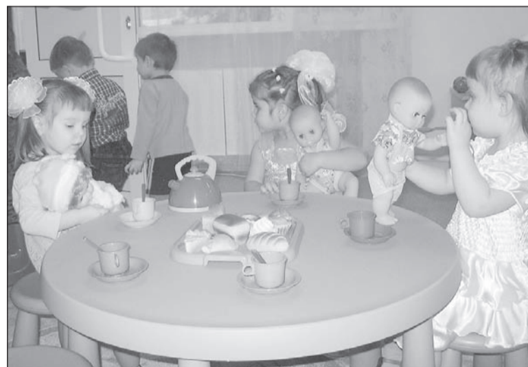
Родительская плата идёт на питание детей в ДОУ.