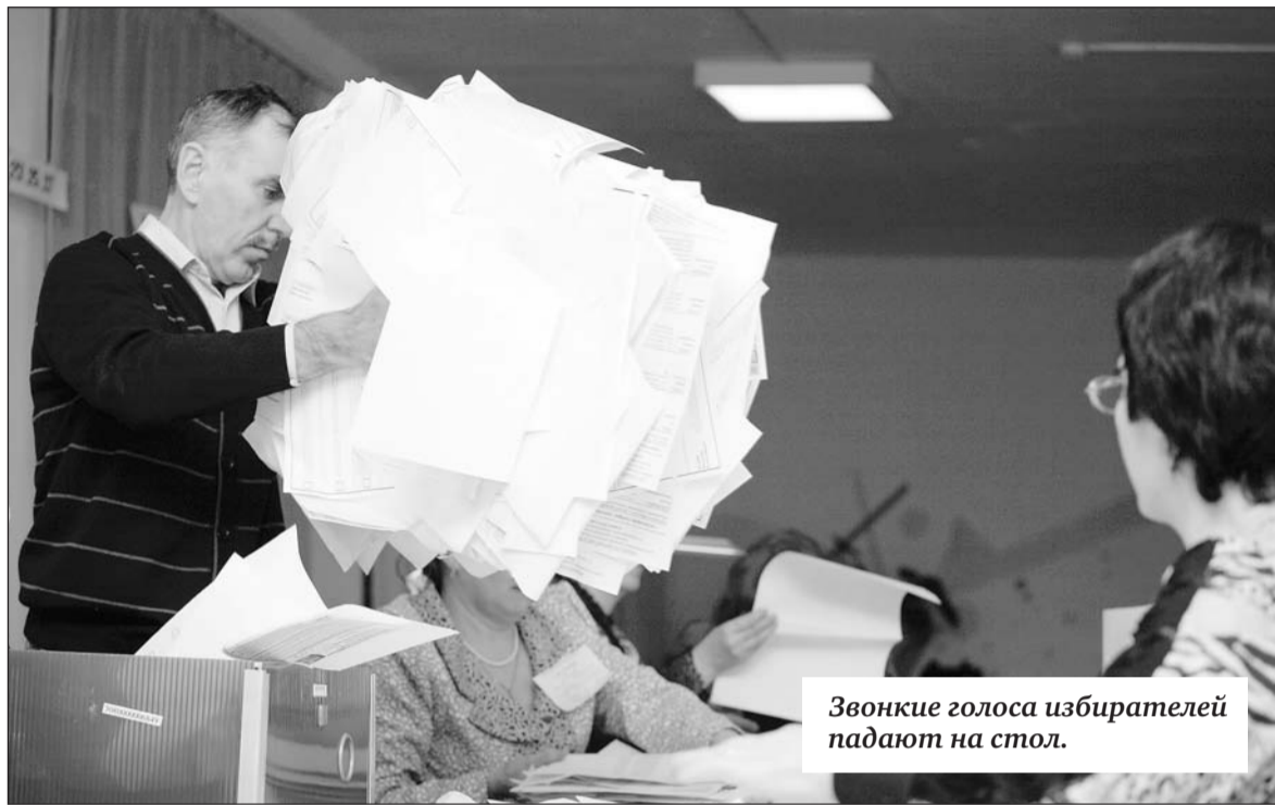
Звонкие голоса избирателей падают на стол.