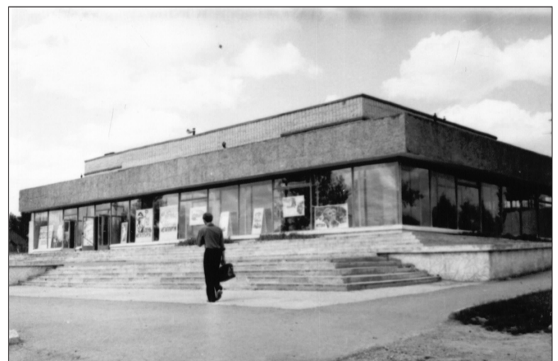
Кинотеатр «Искра», 1978 г.

Если в вашем семейном альбоме есть интересные фото молодой застройки Салды или редкие фотографии со старинными зданиями, которых уже нет, приносите их в редакцию. Построим город заново из фото-кирпичиков!