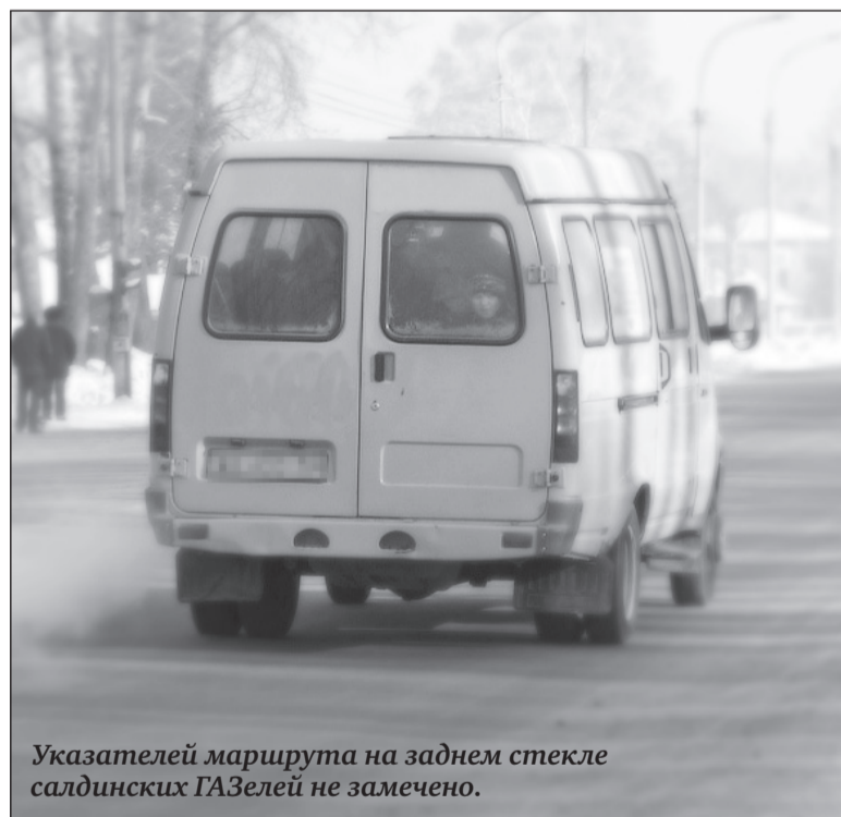
Указателей маршрута на заднем стекле салдинских ГАЗелей не замечено.

Должны ли быть как-то обозначены маршрутные такси? Не ясно, уступать ли ГАЗели вблизи остановки, как маршрутке, или проезжать дальше, если это обычная ГАЗель. Денис.